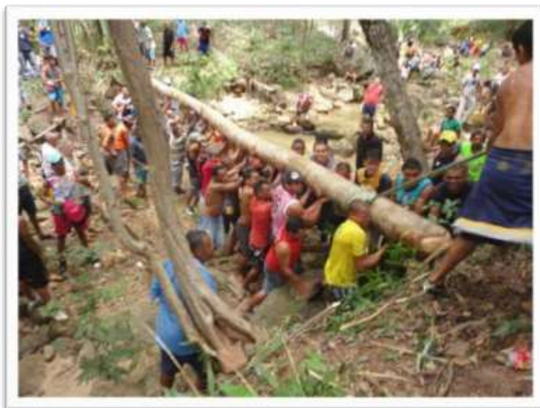
Figura14: Retirada do pau da floresta, rumo à “cama do pau”

presença de todos e enfatizou a importância de se manter viva essa tradição. E assim, com muita bebida e música, foi comemorada mais uma derrubada do pau da bandeira.