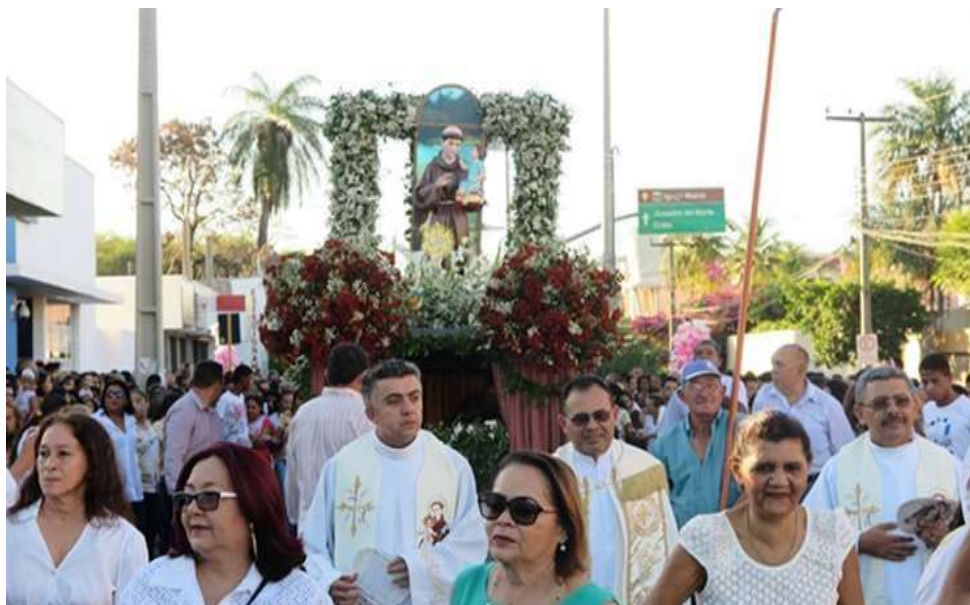
Figura 34: Procissão de encerramento da festa de Santo Antônio

multidão saudando o santo, “VIVA A SANTO ANTÔNIO!”, encerra-se mais uma Manifestação do Pau da Bandeira de Santo Antônio, o “Santo Casamenteiro”.