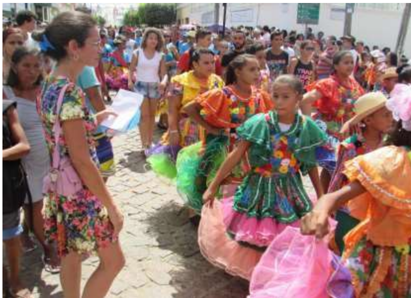
Figura 3: Grupo Quadrilha Junina