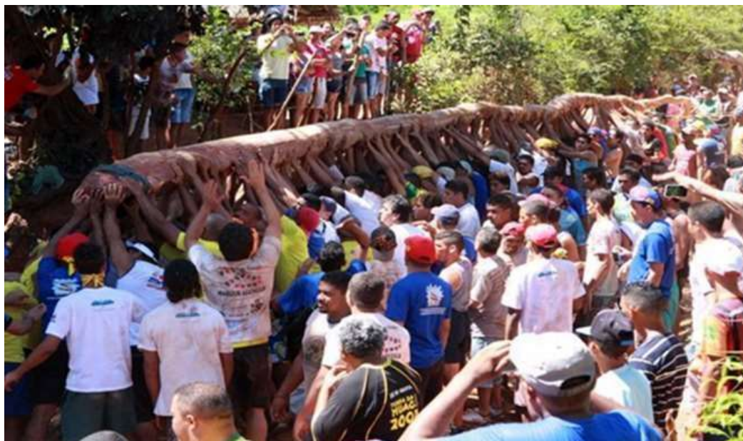
Figura 26: O mastro da bandeira saindo do Sítio Flores.