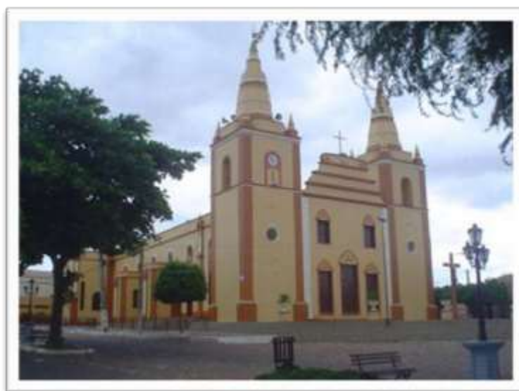
Figura 6: Matriz Santo Antônio, 2017