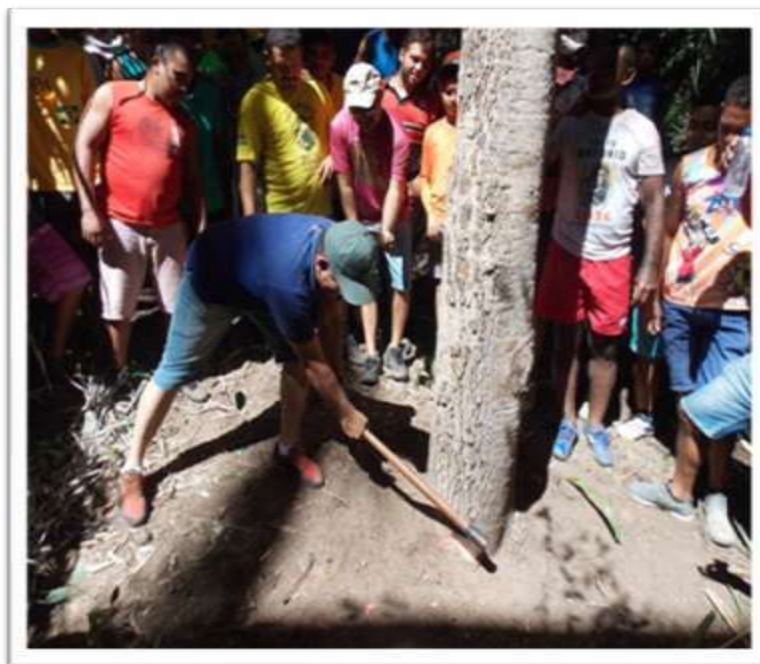
Figura13: Início do corte da árvore que vai servir de mastro para a bandeira

Finalizando os preparativos para o corte, os participantes ocuparam os seus lugares; alguns cuidavam de esticar a corda no sentido indicado pelo cortador, outros esperando o momento do corte. Conforme a tradição, o capitão do pau com o machado em suas mãos fez o primeiro corte na base do tronco, e todos gritaram e aplaudiram.