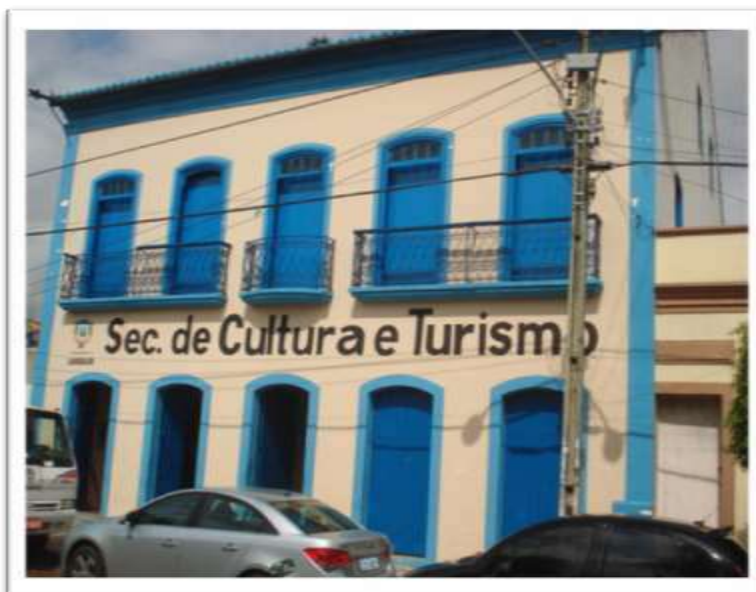
Figura 3: Casarão Hotel. Hoje, Secretaria de Cultura e Turismo. Fonte: Audísio Santos Dias, 2012