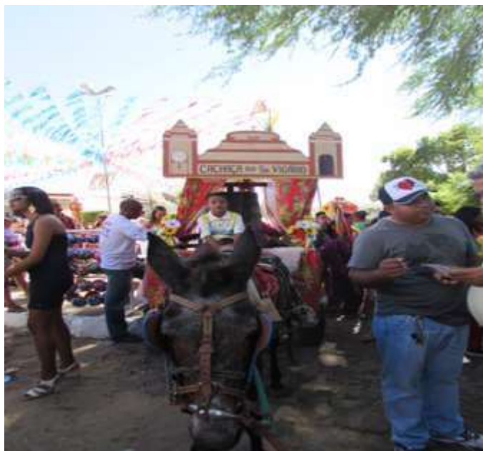
Figura 20- Cachoeira do Seu Vigário, “combustível dos carregadores” Foto: Venusia M.A.P. Magalhães, 28/05/201.