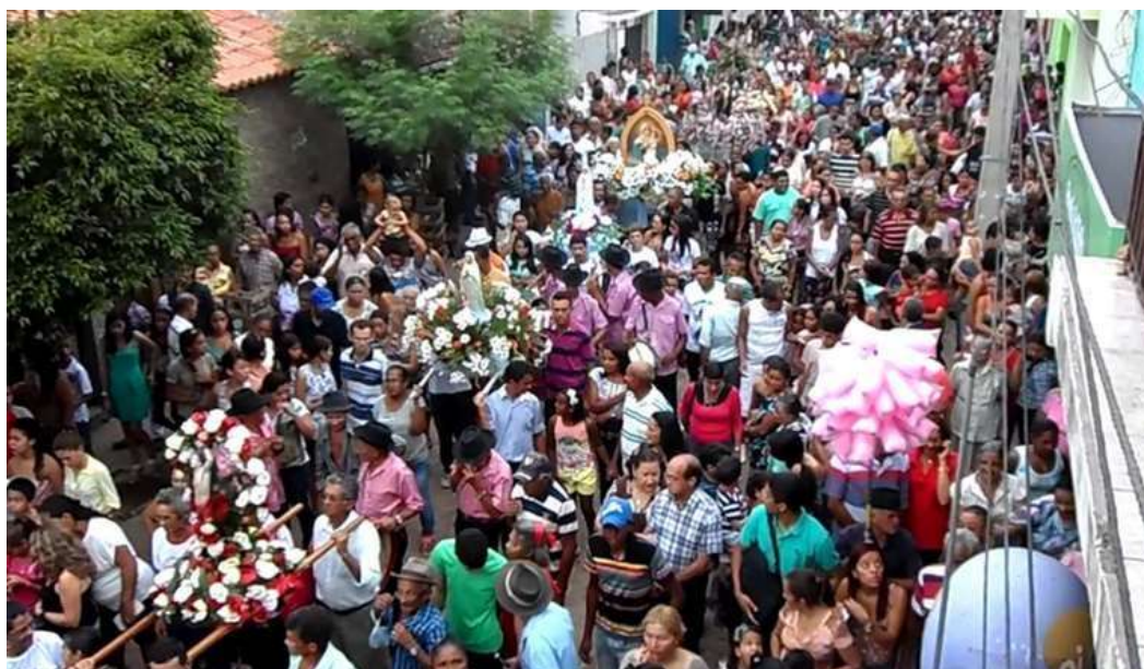
Figura 35 Os Santos padroeiros das comunidades acompanham a procissão de Santo Antônio