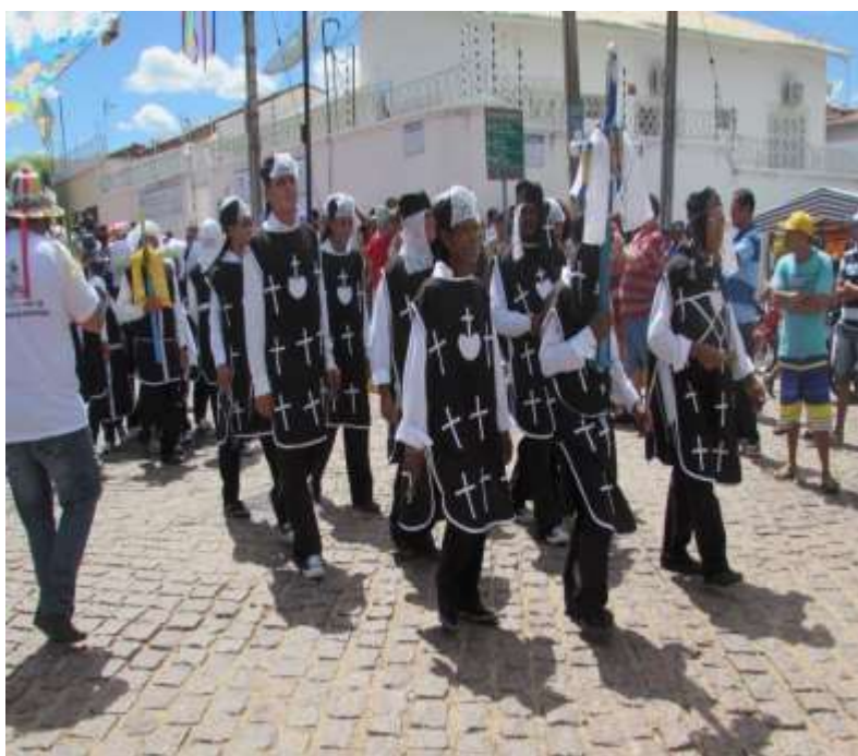
Figura 21- Os Penitentes Foto: Venusia M.A.P. Magalhães, 28/05/2017.