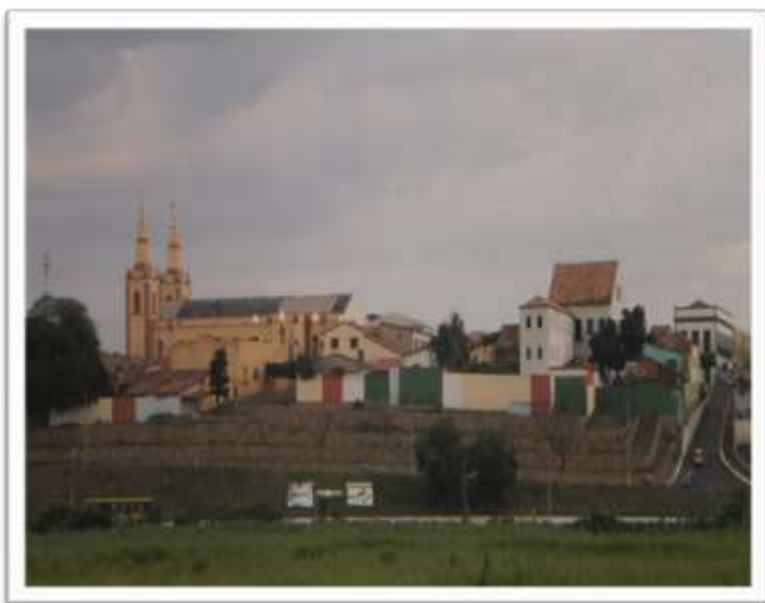
Figura 1: Vale do Salamanca - Colina Matriz de Santo Antônio

Essas homenagens acontecem desde 1928, entre o último domingo de maio e o dia 13 de junho. Trata-se de uma festa erudita e popular, ao mesmo tempo sagrada, profana e espontânea, que caracteriza um modo diferenciado do dia a dia daquela localidade, que espera ansiosamente pelo grande festejo: a Festa do Pau da Bandeira de Santo Antônio.