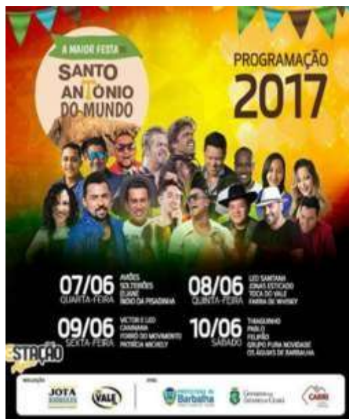
Figura 33: Programação dos shows no parque da cidade 2017

Foto: Venusia M.A.P. Magalhães, 12/05/2017.