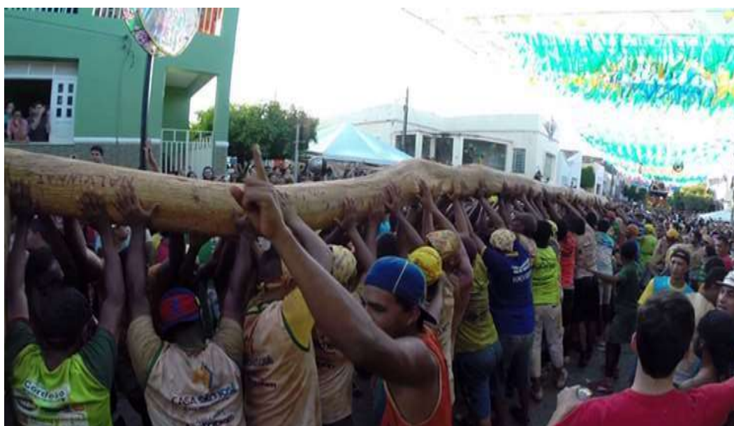
Figura 29: Cortejo passando no corredor cultural