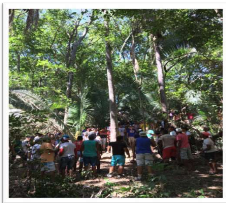
Figura 12: Oração antes do corte