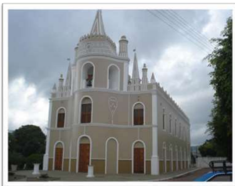
Figura 4: Igreja Nossa Senhora do Rosário

As festas de padroeiros refletem a natureza da relação que as pessoas mantêm com o santo, sobretudo uma identificação que ultrapassa a barreira do inatingível, abrindo a possibilidade de estar mais próximo do santo, seja por meio de uma oferenda, um sacrifício, uma promessa, um ritual, seja qualquer gesto ou ato cuja resposta se registra no imaginário popular. Segundo D'Abadia (2010), o santo padroeiro fortalecia as relações comunitárias e os laços de pertencimento das comunidades. Por isso, a consagração de capelas, igrejas e paróquias faz parte de