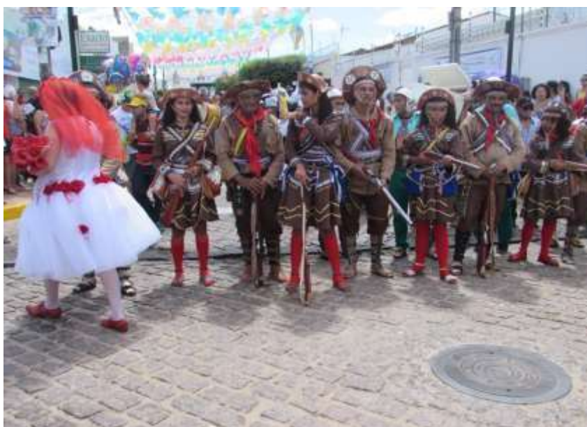
Figura 23- Grupo Bacamarteiro

Foto: Venusia M.A.P. Magalhães, 28/05/2017.