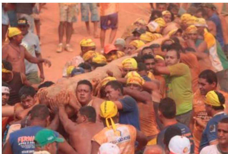
Figura 27: O cortejo descendo a serra