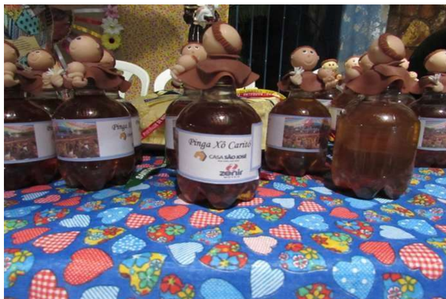
Figura 17: Kit do milagre. “Tenda das Solteironas”

santo e explique que o deixará ali até que ele lhe traga um amor. Se demorar acontecer, converse novamente com o santo e diga que ele só sairá dali quando você encontrar um amor.