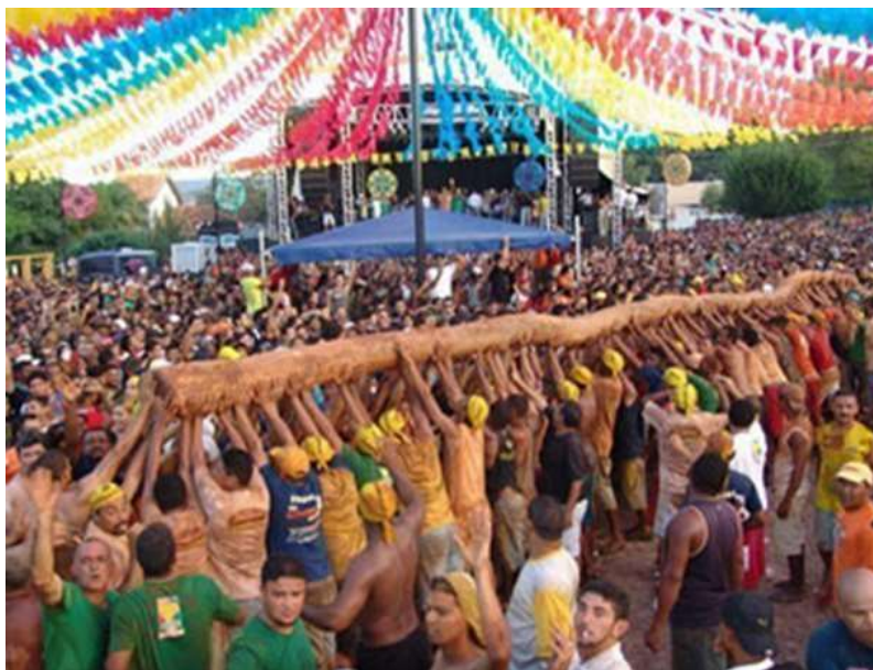
Figura 28: Cortejo no Largo Rosário. Momento em que erguem o pau do chão para prosseguir com o cortejo.