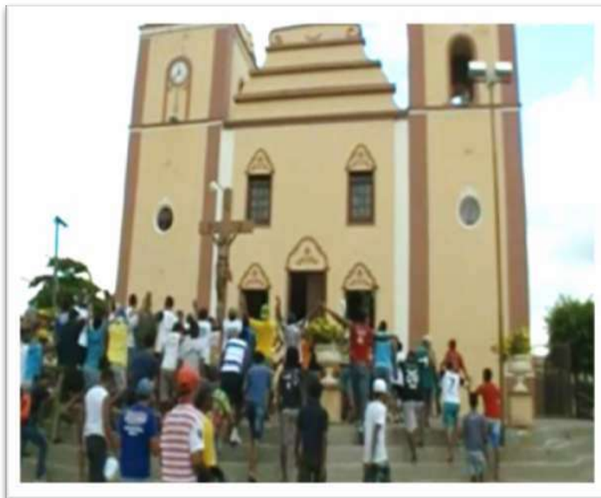
Figura 10: Bênção dos “carregadores antes da subida da serra para o corte do pau”