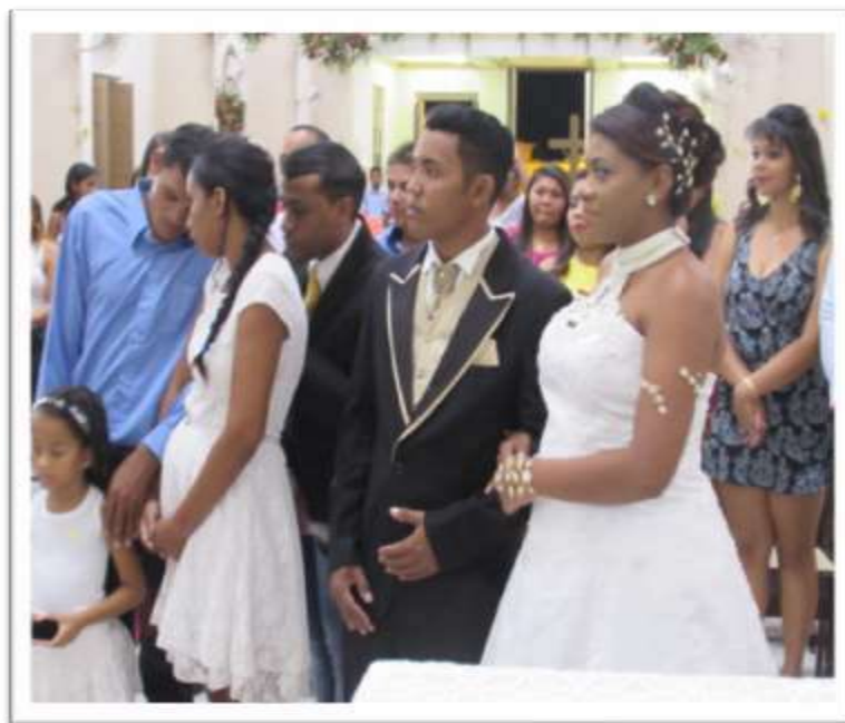
Figura16: Casamento coletivo “Noite das Solteironas”

Na mesma tarde, após receber o seu relato, entre uma conversa e outra sobre as simpatias, ela passou a mostrar todas as simpatias que produz junto com as suas amigas solteironas.