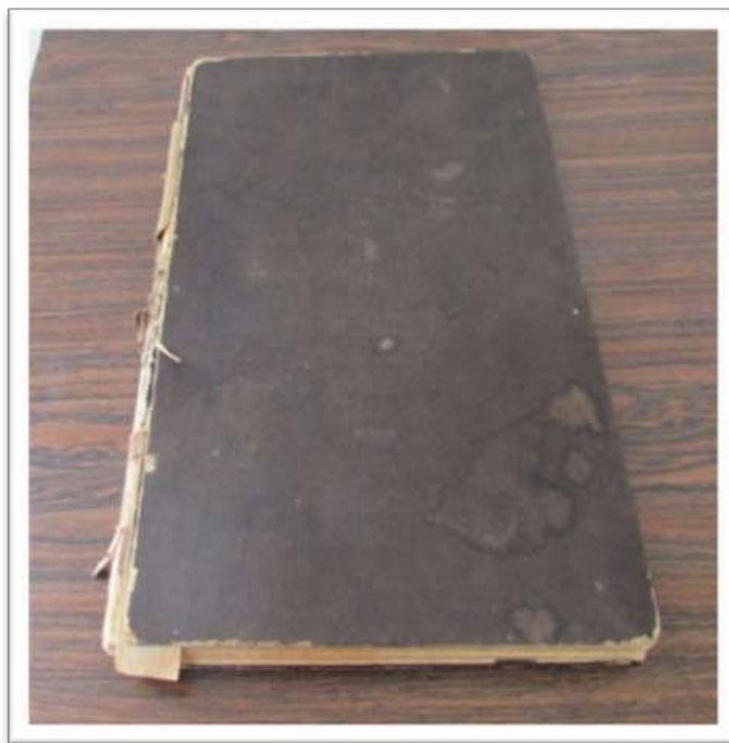
Figura 7: 1º Livro de Tombo.