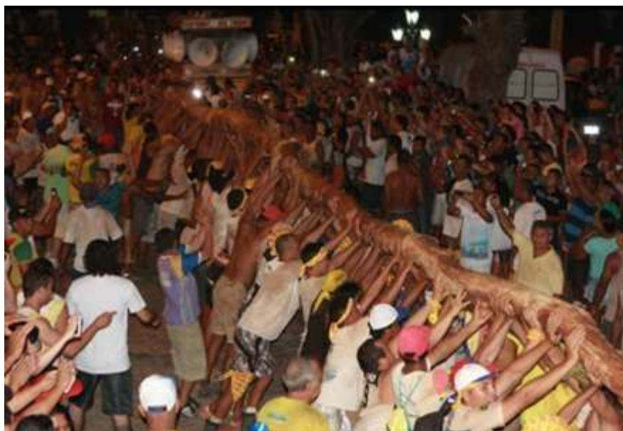
Figura 30: O cortejo chegando à Matriz de Santo Antônio

de mais uma festa do glorioso Santo Antônio, que prosseguirá até o dia 13 de junho, data do padroeiro.