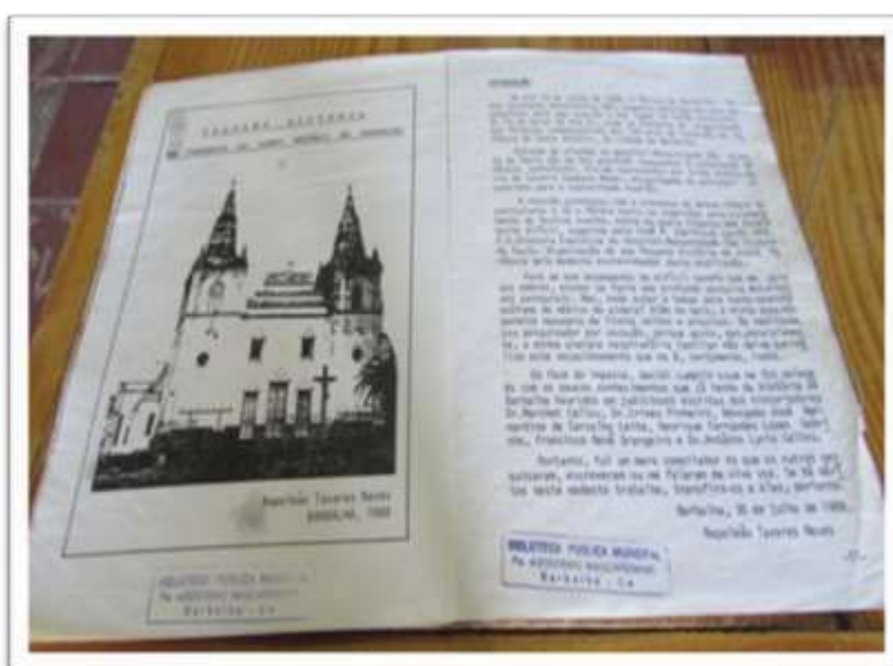
Figura 9: História da cidade de Barbalha

Assim, as festas não são iguais, o processo de modernização transforma-as em espetáculos, com estruturas grandiosas e suntuosas onde muitas vezes fogem ao contexto do meramente religioso.