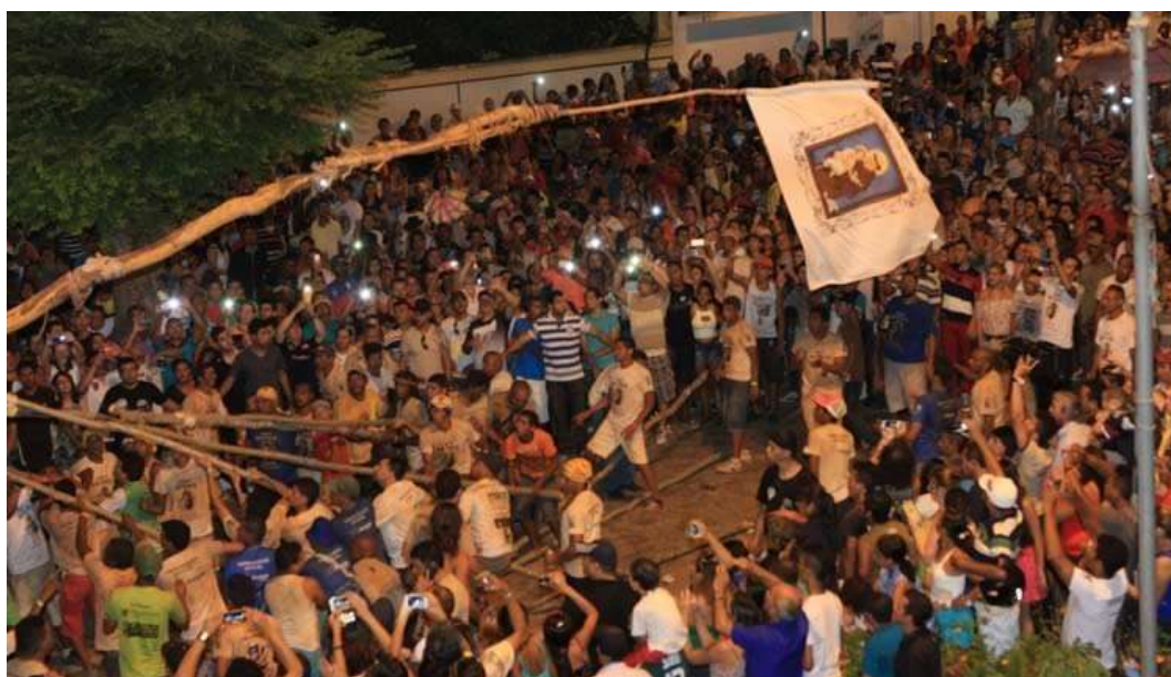
Figura 31: Hasteamento da bandeira de Santo Antônio