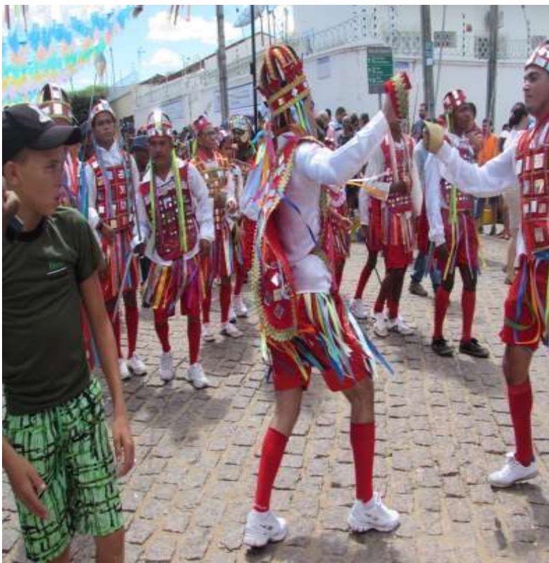
Figura 22- Reizado do Congo

Foto: Venusia M.A.P. Magalhães, 28/05/2017.