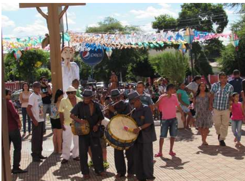
Figura 2: Fiéis chegando para a celebração eucarística

da Igreja Matriz e, com a salva de fogos de artifícios, realiza assim a abertura oficial da festa. É chegado o grande dia, o Dia do Pau da Bandeira. Ao terminar a alvorada, os bacamarteiros fazem ecoar a explosão da espingarda primitiva para lembrar a celebração da missa que dá início aos festejos. Enquanto a missa não começa, os grupos folclóricos chegam de todos os quadrantes de Barbalha, saudando o grande padroeiro, os grupos de reisados, penitentes, pastorinhas, quadrilhas, entre outros que vão chegando e, com a suas apresentações no meio da rua ou na calçada da igreja, animam os devotos que ali se encontram, pois não precisam de palco e muito menos da acomodação da plateia.