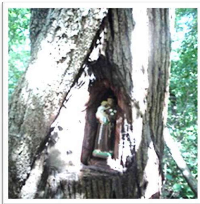
Figura 11: Imagem de Santo Antônio, guardada no tronco da árvore, para ser retirada em maio de 2018

Gonzaga, o Rei do Baião. Ao chegar ao sítio, antes do corte, o capitão levou os participantes para o local onde a imagem de Santo Antônio seria colocada e ficaria até o ano seguinte.