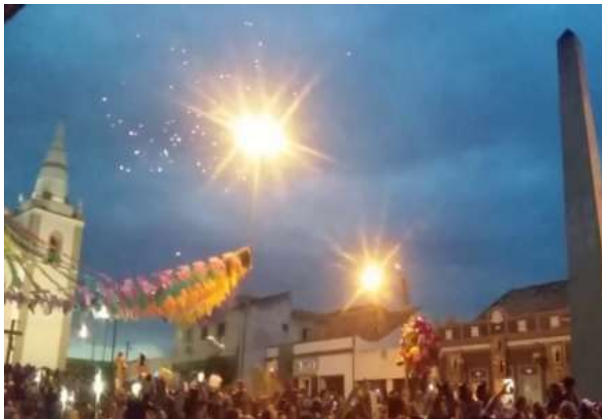
Figura 32: O show de fogos e a multidão louvando a Santo António

SANTO ANTÔNIOOOO!, VIVA A FESTA DA BARBALHAAA!". E tudo se transforma em festa.