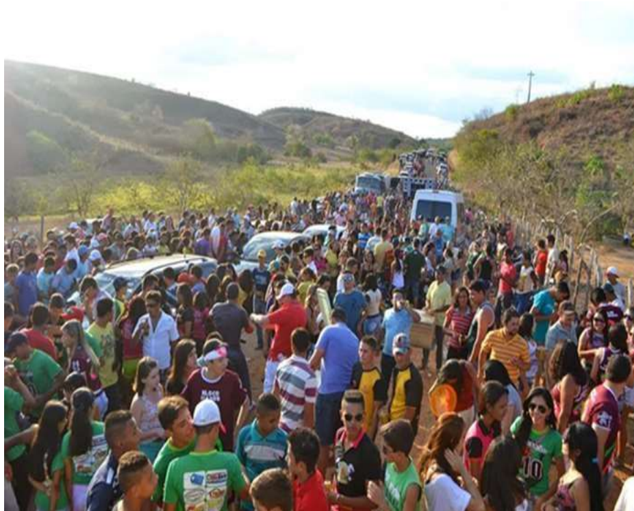
Figura 25: Os devotos e curiosos vão juntos com os carregadores buscar o pau da bandeira