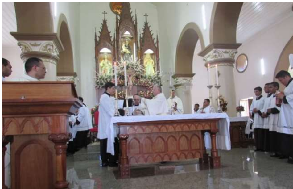
Figura19: Celebração eucarística

Foto: Venusia M.A.P. Magalhães, 28/05/201.