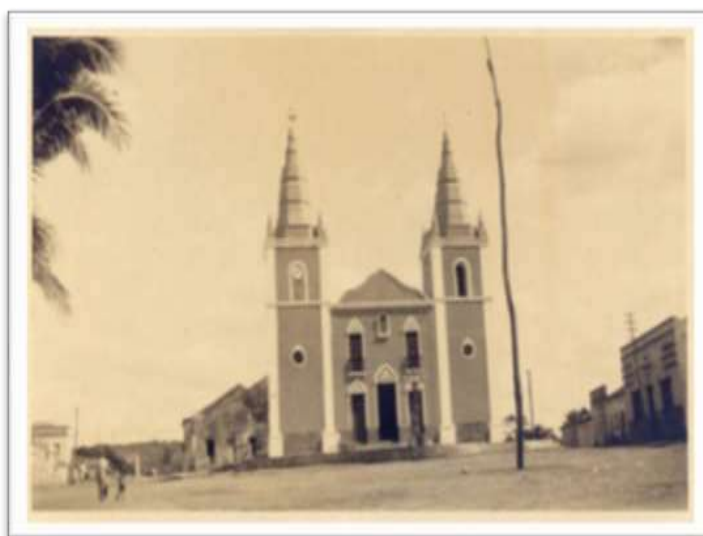
Figura 5: Igreja Matriz de Santo Antônio, 1941.