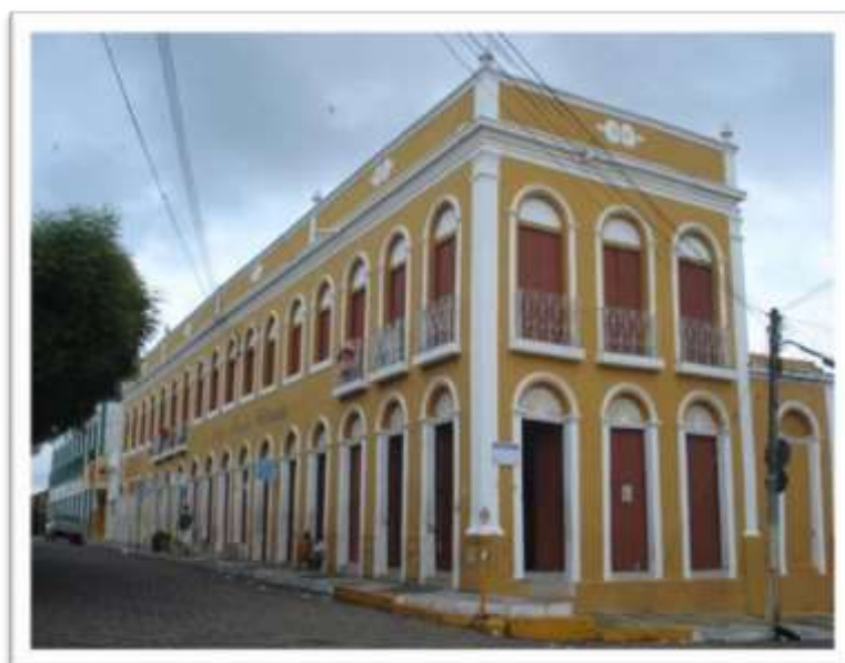
Figura 2: Solar Maria Olímpia