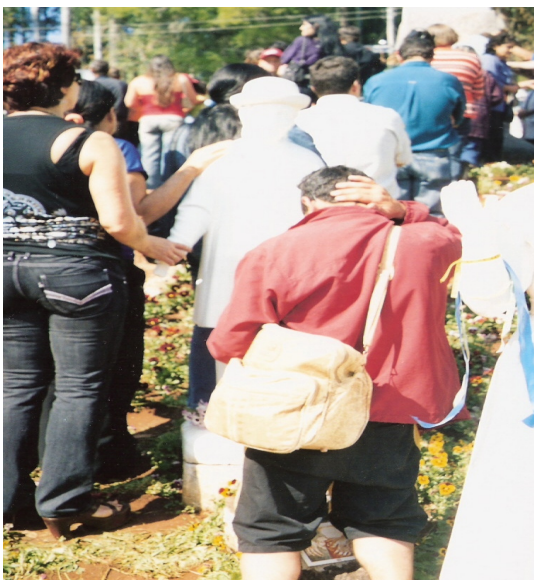
Homem ajoelhado diante da imagem do “vidente” pôs a mão atrás da cabeça e estava como que “benzendo” uma dor.

Essa relação traz em si um paradoxo da imanência e da transcendência. Imanência, posto que o percebido não poderia ser estranho àquele que percebe, o objeto tocado é de certo modo conhecido; transcendência, posto que comporta sempre um além do que está imediatamente dado, pois aponta para além da visão simples do objeto 138 .