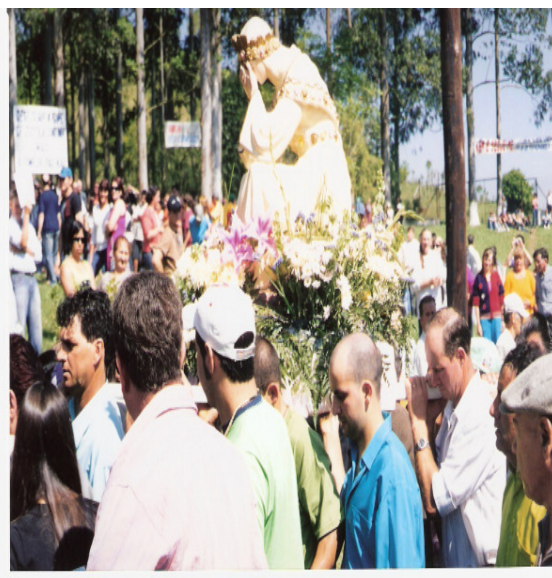
Nossa Senhora de Salette com símbolos e correntes no templo e na procissão