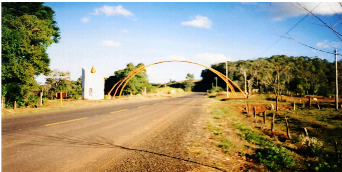
Portal de entrada de Marcelino Ramos

um santuário que exerce a acolhida não se restringindo as informações históricas, mas manifestando a identidade religiosa 72 .