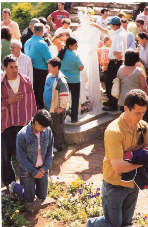
Fiéis em torno do Fac-Símile

Até aqui, tivemos, a partir de alguns fatos apresentados, e brevemente refletidos, algumas nuances do contexto que desenvolveu a espiritualidade saletina, bem como o contexto que acolheu essa espiritualidade e a repercussão dessa espiritualidade na sociedade marcelinense. Em relação às origens e compreensões de Romaria retomarei no quinto capítulo.