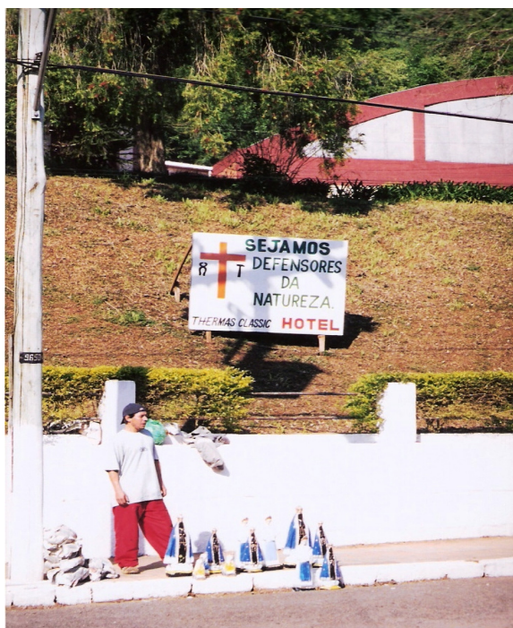
Comércio ambulante de imagens

Na romaria de 2006, percebi que muitas pessoas se encontram em uma fila a fim de receber a bênção dos padres, também levam imagens, escapulários e terços para serem bentos pelo sacerdote. Esse momento na verdade, tato e audição andam par a par. Alguns sacerdotes pronunciam bênçãos com fórmulas mais extensas, impondo as mãos na cabeça dos/as devotos/as, porém um sacerdote em especial encostava a sua testa junto à testa do romeiro ou da romeira ao mesmo tempo em que impunha as mãos na cabeça do romeiro ou da romeira e pronunciava a bênção.