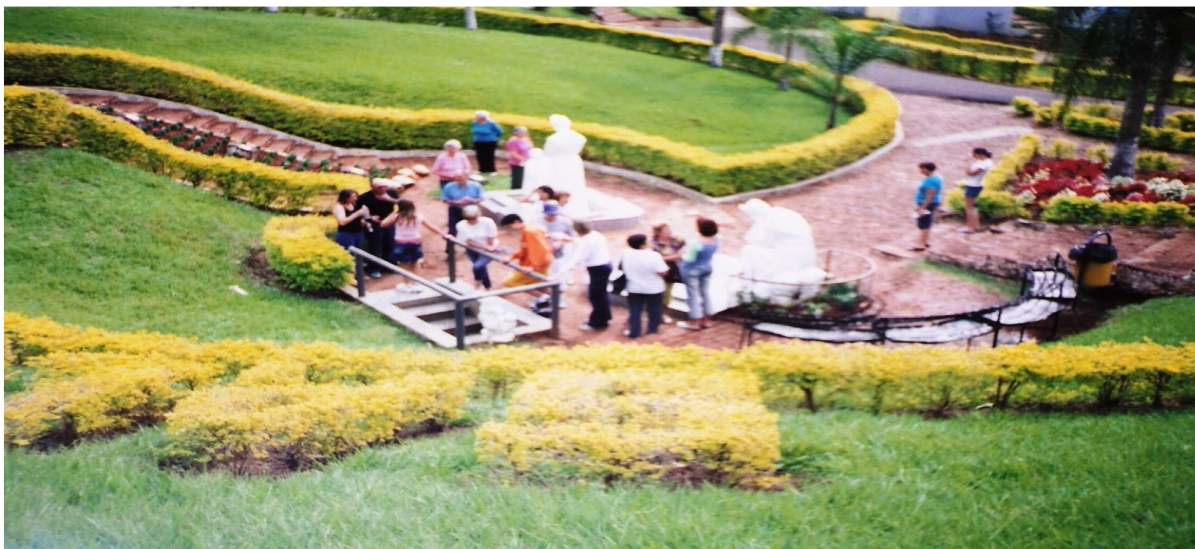
Imagem do Fac-Símile

destruição entendida como “ímpeto iconoclasta” pelo pesquisador Fassini 57 , sem que este entre em maiores detalhes em torno do assunto.