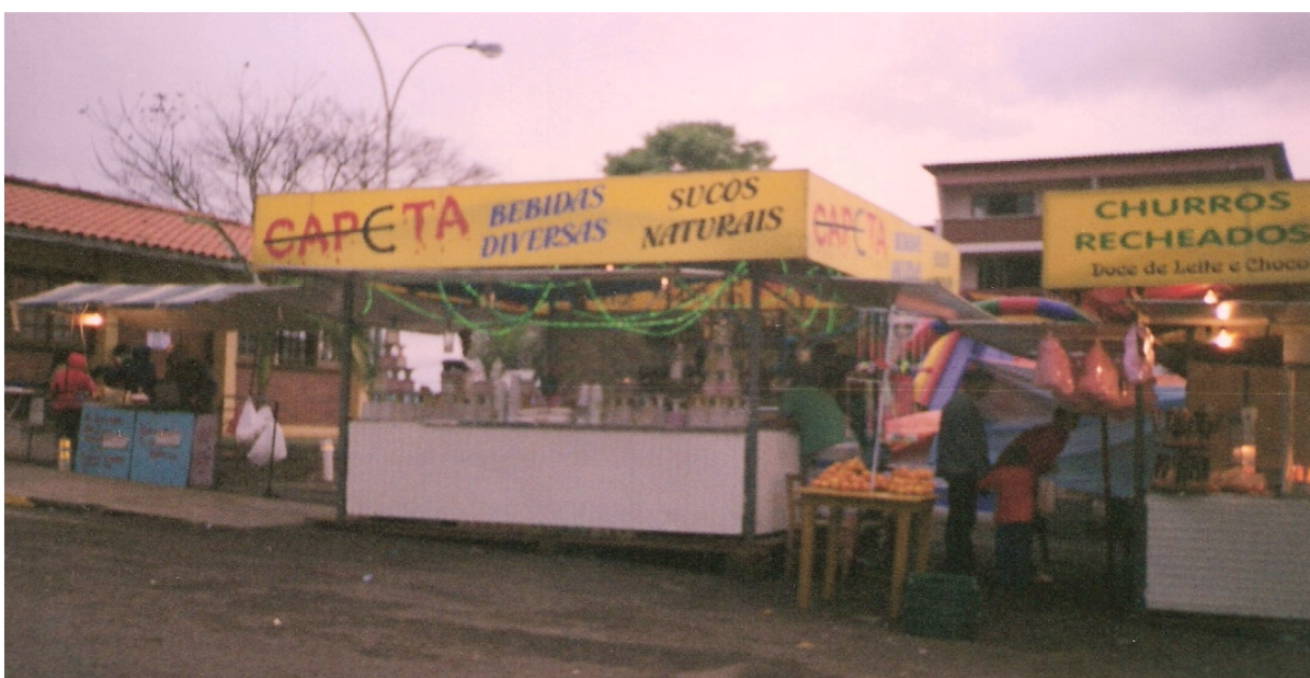
Barracas de consumo alimentício

Para os sabores da festa, existem muitas barracas que comercializam exclusivamente comidas e bebidas, em especial bebidas alcoólicas, como, por exemplo, o cocktail conhecido como “capeta”. Na virada da noite de sábado para o dia de domingo, as barracas ficam abertas até altas horas da madrugada, mas no último dia a circulação é intensa somente até escurecer, quando é hora de pessoas do interior retirarem-se para as lidas com os animais. Somente essas barracas de bebidas e comidas permanecem abertas até mais tarde, em torno de 22 horas.