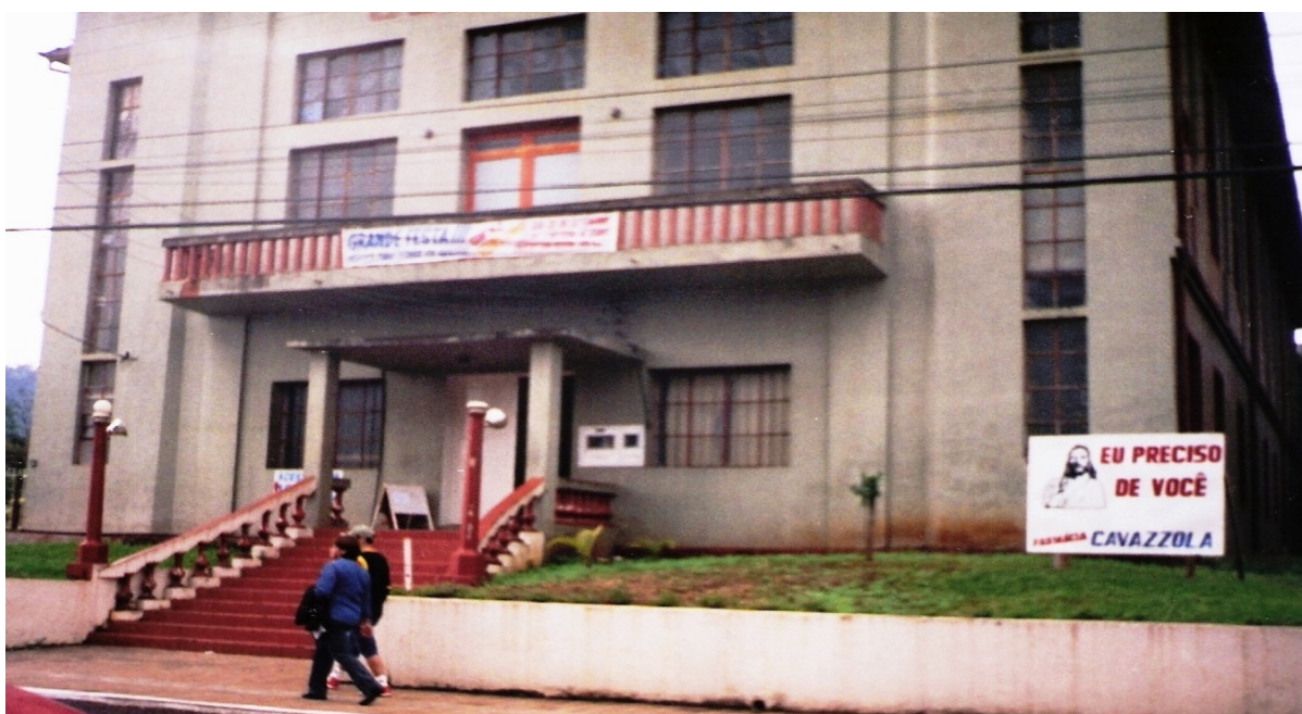
Fachada do Clube Concórdia

Na tarde de sábado saí para olhar a cidade. A cidade estava quase “pronta”. Ao longo do caminho da procissão já estavam colocadas placas com dizeres como: “Nossa Senhora solidária com o povo”; “Sejamos firmes na justiça”; “Paz” e uma imagem de Jesus dizendo: “Eu preciso de você”, bem em frente ao Clube Concórdia, onde mais tarde naquele dia haveria um baile.