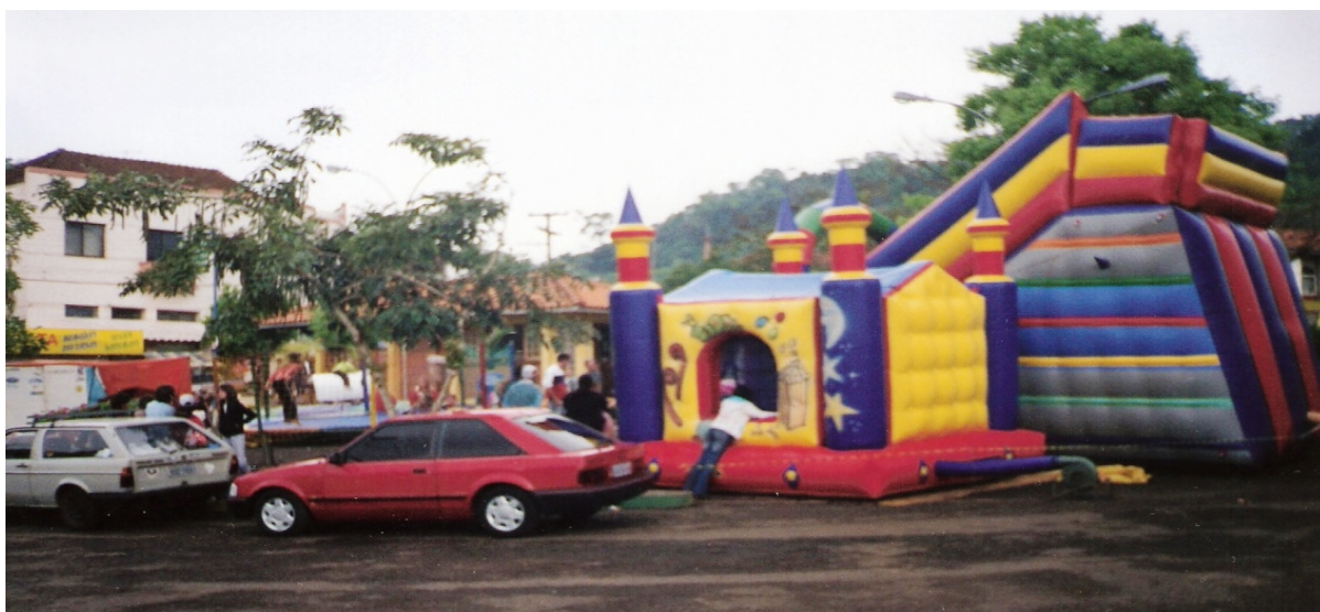
Parque de diversão para as crianças.

Na rua principal do centro os comerciantes ambulantes estavam instalando-se, contudo este ano a grande parte optou por instalar-se no interior do salão da Igreja Matriz. Os ambulantes conhecidos como “camelôs”, comercializavam centenas de coisas: brinquedos, eletrônicos, bijuterias, CD/ DVD's, objetos de decoração, roupas, bebidas, comidas e imagens de diversos santos: Santa Terezinha, Santo Antonio, São Jorge, Nossa Senhora Aparecida e, claro, Nossa Senhora Salette. Os camelôs instalam-se como podem e, um dos lugares mais cobiçados é a via de acesso ao Santuário de Salette, incluindo aí o pátio da Igreja Evangélica (IECLB).