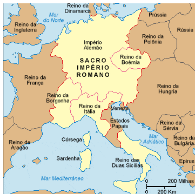
Imagem: Sacro Império Romano-Germânico