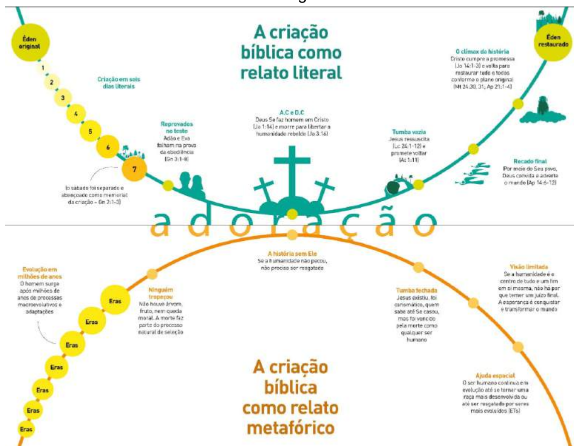
Figura 28 – O gráfico mostra as implicações da crença na semana literal da criação (em seis dias de 24 horas cada) e da ideia de uma criação como relato metafórico/alegórico

Fonte: arquivo pessoal do autor; arte de Flávio Carvalho.