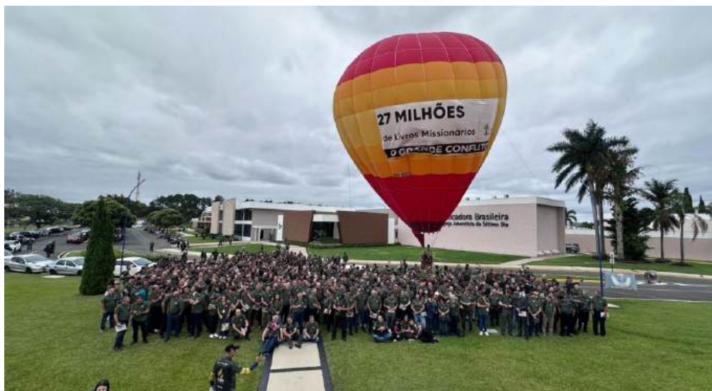
Figura 4 – Foto com os funcionários da CPB que participaram da entrega do livro