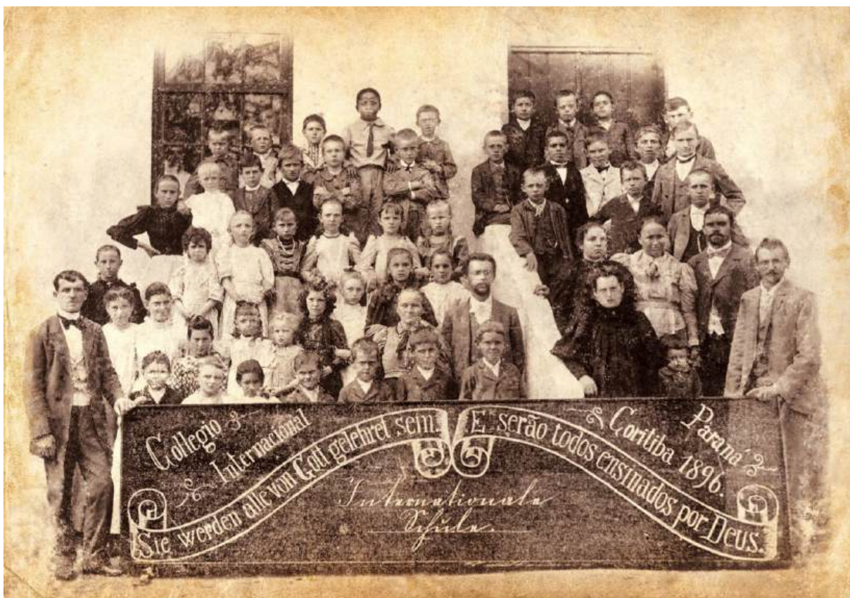
Figura 15 – professores e estudantes em 1896

91