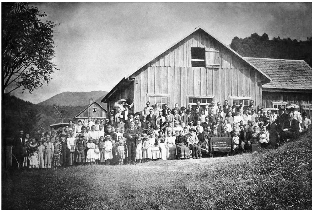
Figura 16 – Igreja Adventista de Gaspar Alto