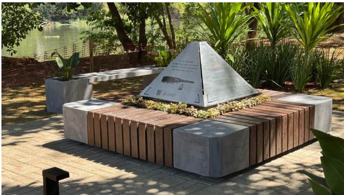
Figura 7 – Monumento comemorativo dos 130 anos do batismo de Guilherme Stein Jr.