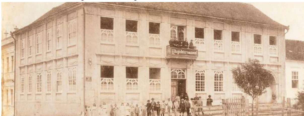
Figura 14 – Colégio Internacional de Curitiba

Fonte: Encyclopedia of Seventh-day Adventists. 90