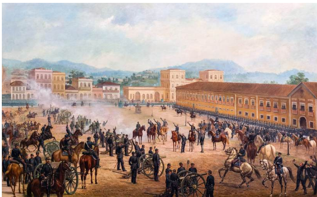
Figura 3 – “Proclamação da República”, 1893, óleo sobre tela de Benedito Calixto (1853-1927)

Fonte: pintura de Benedito Calixto recuperada na Wikipedia. 55