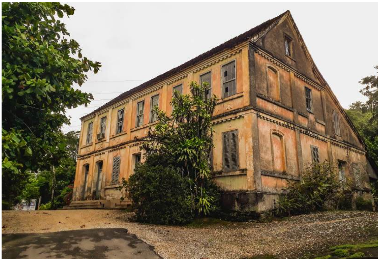
Figura 10 – Casarão Hort: local de chegada do primeiro pacote de literatura adventista ao Brasil (1880)