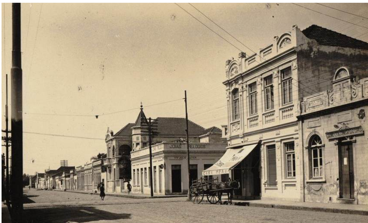
Figura 2 – Rua Independência, em São Leopoldo, RS, em 1924; primeira colônia alemã no Brasil

a tensões sociais, políticas e espirituais 42 – ajuda a compor um pano de fundo rico para entender os escritos de Guilherme, especialmente seu empenho em articular a fé adventista em diálogo (e em confronto) com os desafios intelectuais de sua época.