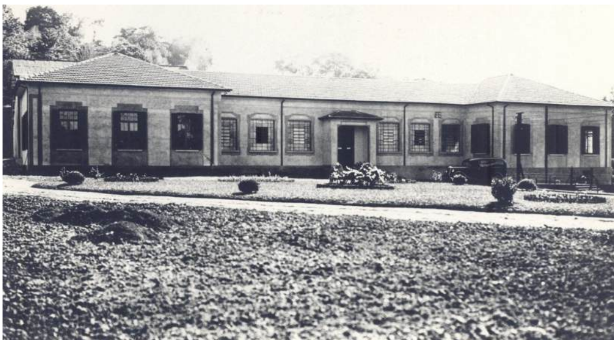
Figura 17 – Casa Publicadora Brasileira em Santo André, SP

94