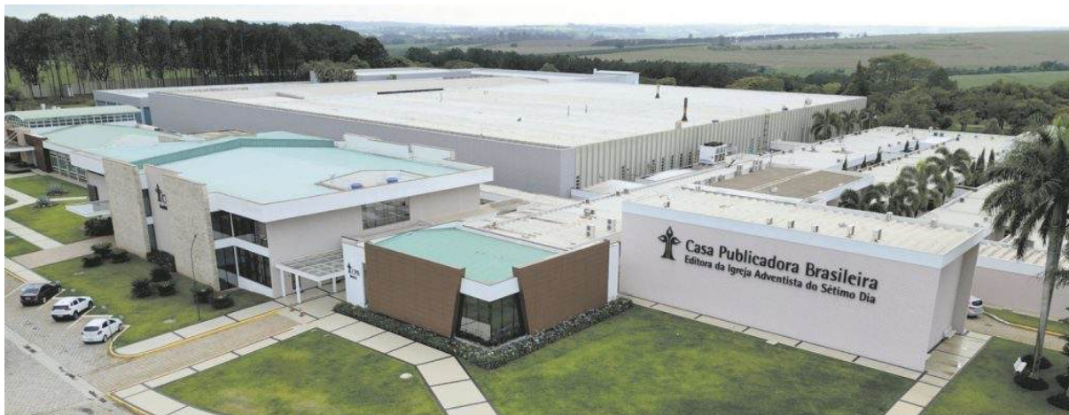
Figura 18 – Casa Publicadora Brasileira, em Tatuí, SP, desde 1985