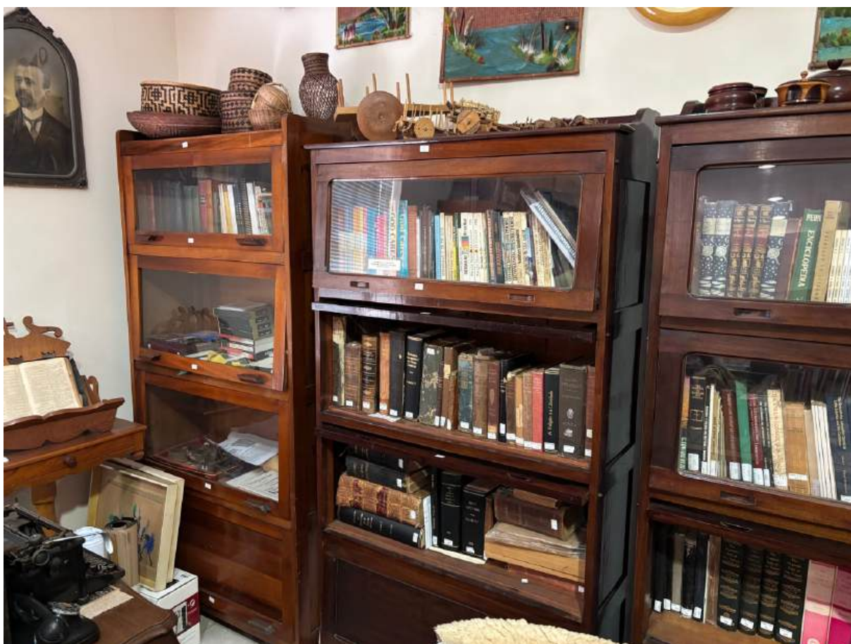
Figura 21 – O Núcleo de Documentação e Informação Guilherme Stein Jr., no Centro Cultural da Sociedade Criacionista Brasileira, em Brasília, DF, preserva parte da biblioteca que pertenceu ao pioneiro

[Alice] foi sepultada em Indaiatuba, ao lado do tio Simão. [...] Ali também estão sepultados os velhos avós, tios e tias. Ali espero também ser sepultada na mesma cova com Guilhermino [o esposo], e lá ficaremos até a vinda de nosso bendito Salvador, na esperança bendita de um dia encontrar nossos queridos que já dormiram em Cristo. 108