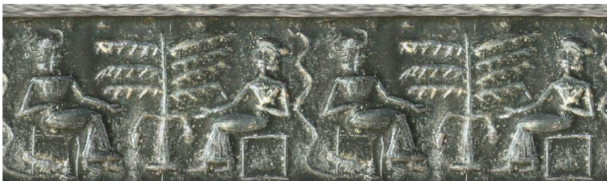
Figura 31 – Cilindro-selo sumério conhecido como “Cilindro da Tentação”

Outro paralelo interessante é apontado a partir da página 37 de seu livro A Torre de Babel e Seus Mistérios . 182 Guilherme destaca as semelhanças entre o relato bíblico da queda e a imagem talhada em um cilindro de pedra (Cilindro da Tentação, do século 23 a.C.), hoje mantido no Museu Britânico, no qual se vê um casal sentado, uma serpente e uma árvore. O deus Ea entrega o destino do casal ao deus Marduk, seu redentor.