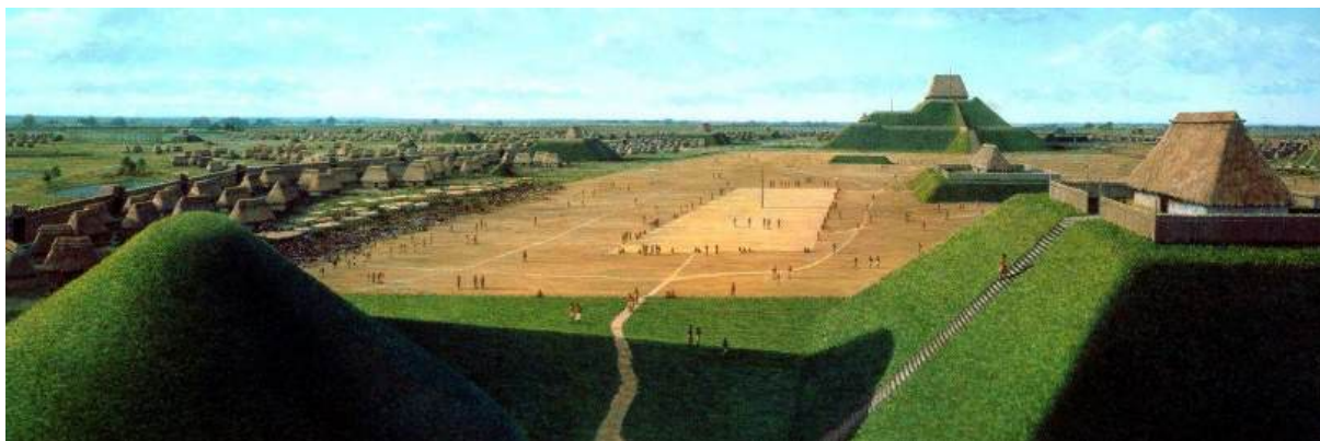
Figura 20 – Os moundbuilders foram povos pré-colombianos responsáveis pela construção de montes artificiais – ou mounds – encontrados sobretudo nas regiões dos rios Mississippi, Missouri e Ohio, nos Estados Unidos. A semelhança entre as formas desses “montes” e os zigurates mesopotâmicos é notável