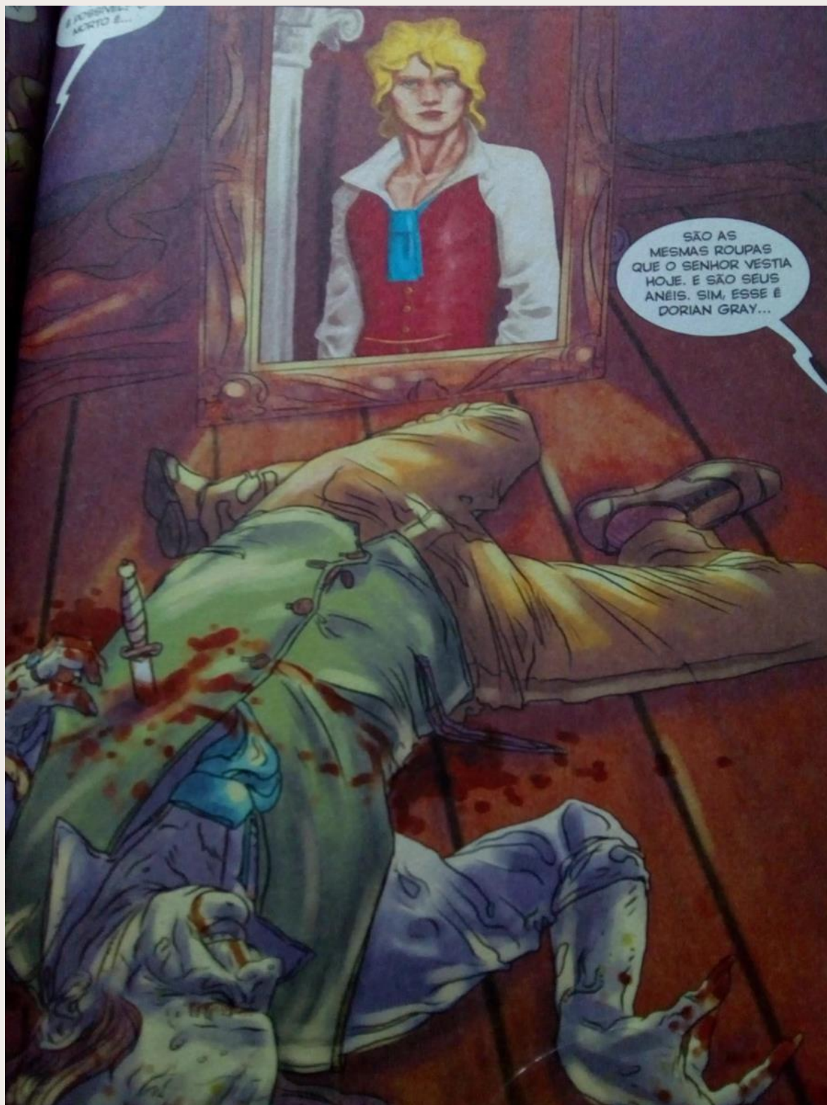
Figura 4: Morte e redenção