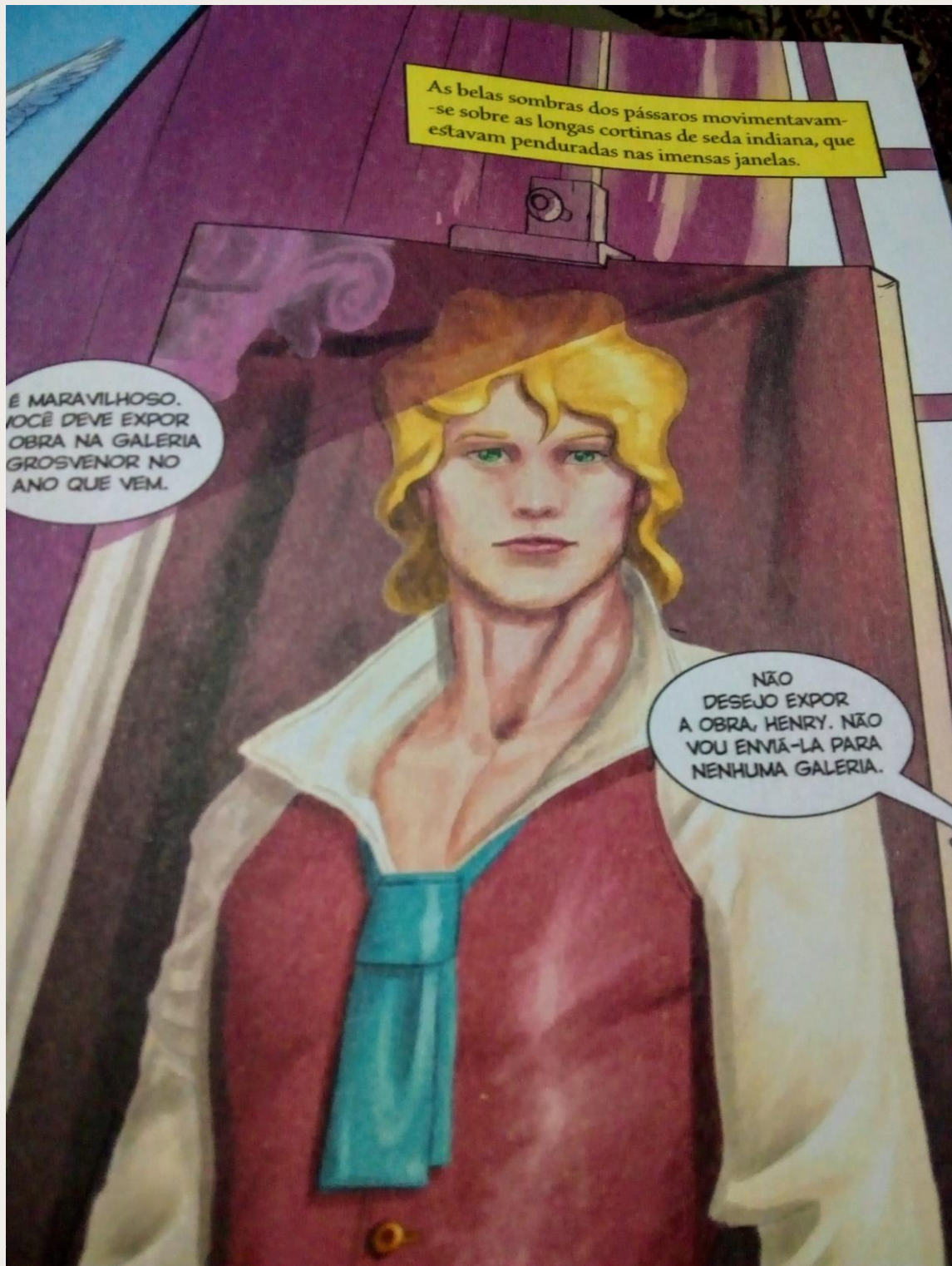
Figura 3: O retrato de Dorian Gray

Fonte: MORHAIN, Jorge C. O retrato de Dorian Gray . Tradução Paloma Blanca Alves Barbieri. Ilustração Martín Túnica. Jandira, SP: Principis, 2020, p. 7. [Quadrinhos]