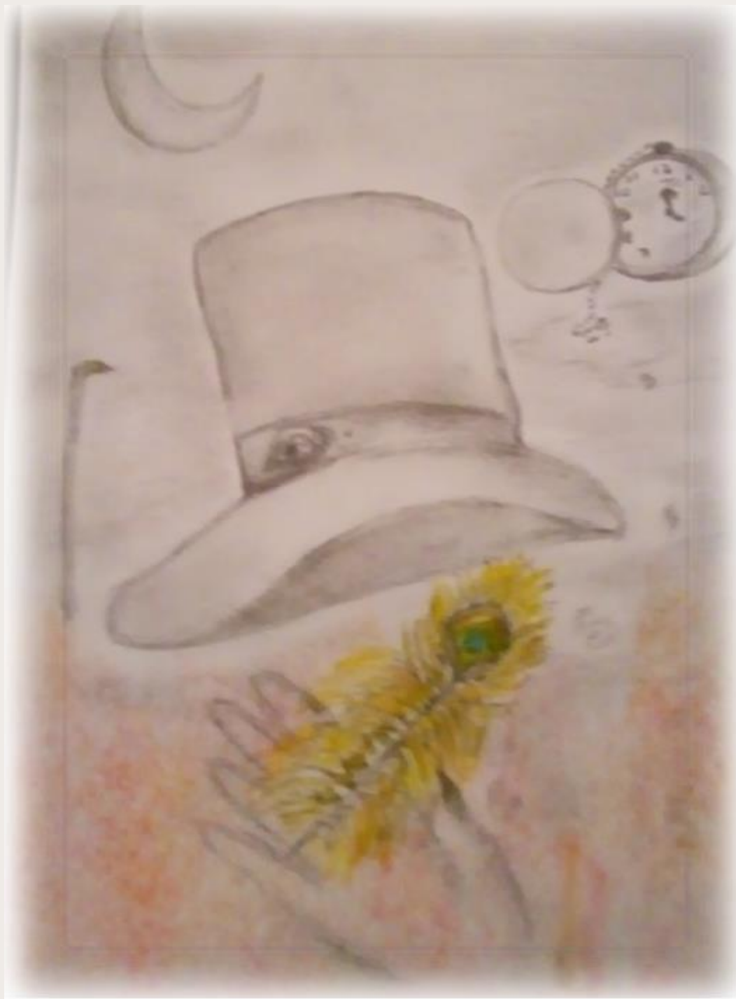
Figura 1: Peccatum et malum

Inspirada no romance O retrato de Dorian Gray de Oscar Wilde