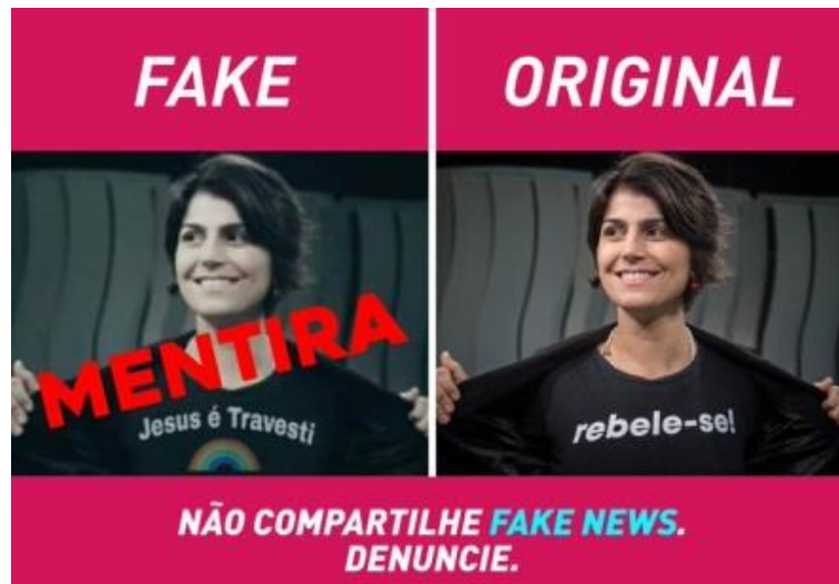
Figura 1: “PRESTEM ATENÇÃO! Mentiras não passarão! Nos ajude a compartilhar a verdade!”

D'ÁVILA, Manuela, 02 out. 2018, 12h23min. Twitter: @ManuelaDavila. 47