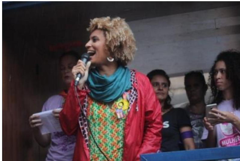
FRANCO, Marielle, 08 mar. 2018, 20h00min. Twitter: @mariellefranco. 66