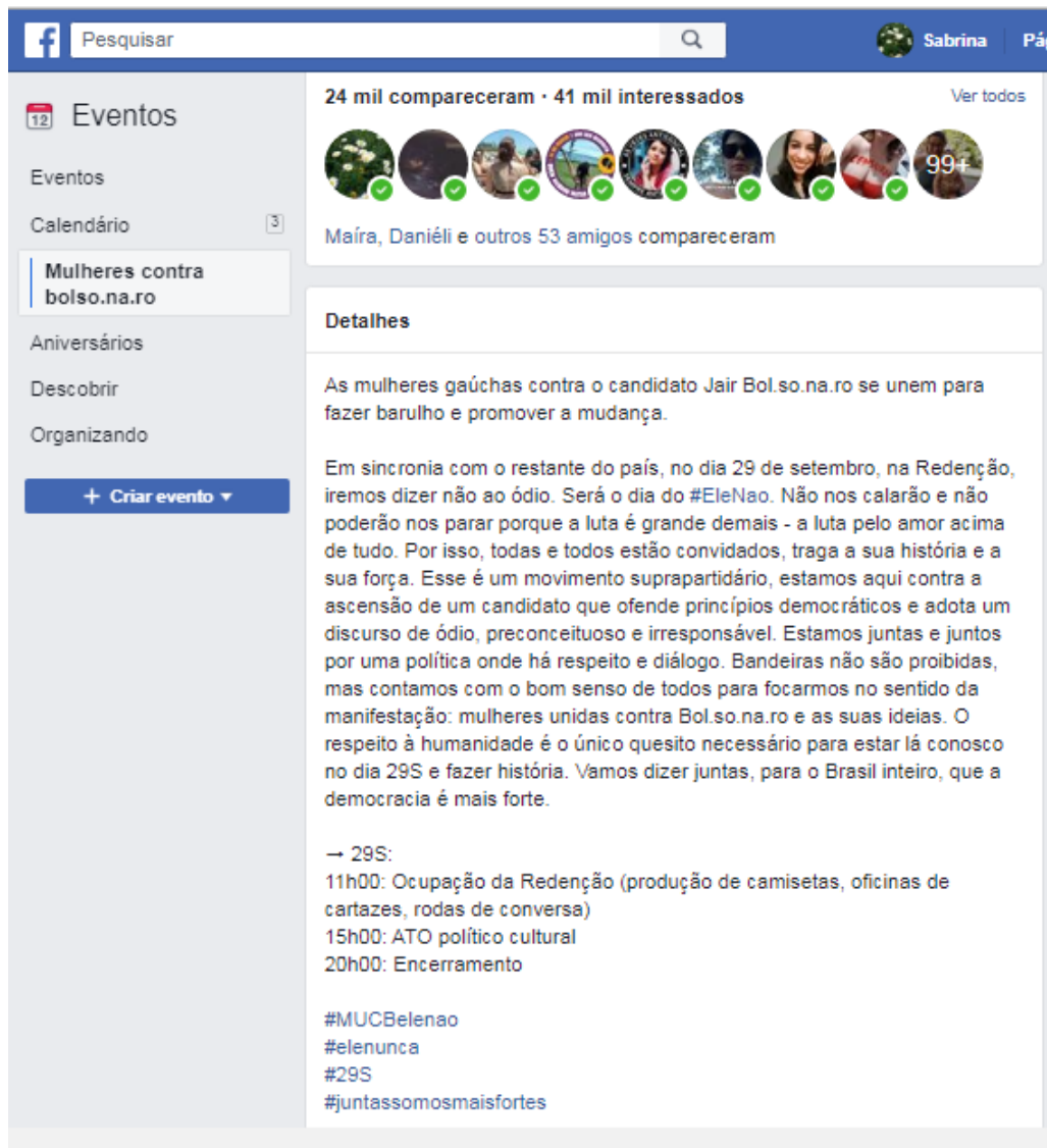
Figura 3: “Mulheres contra bolso.na.ro”

136