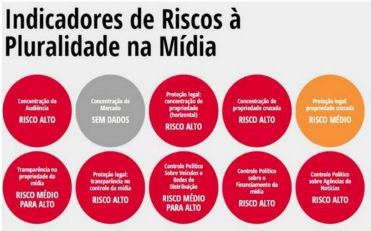
Figura 1 — Indicadores de riscos à pluralidade na mídia no Brasil