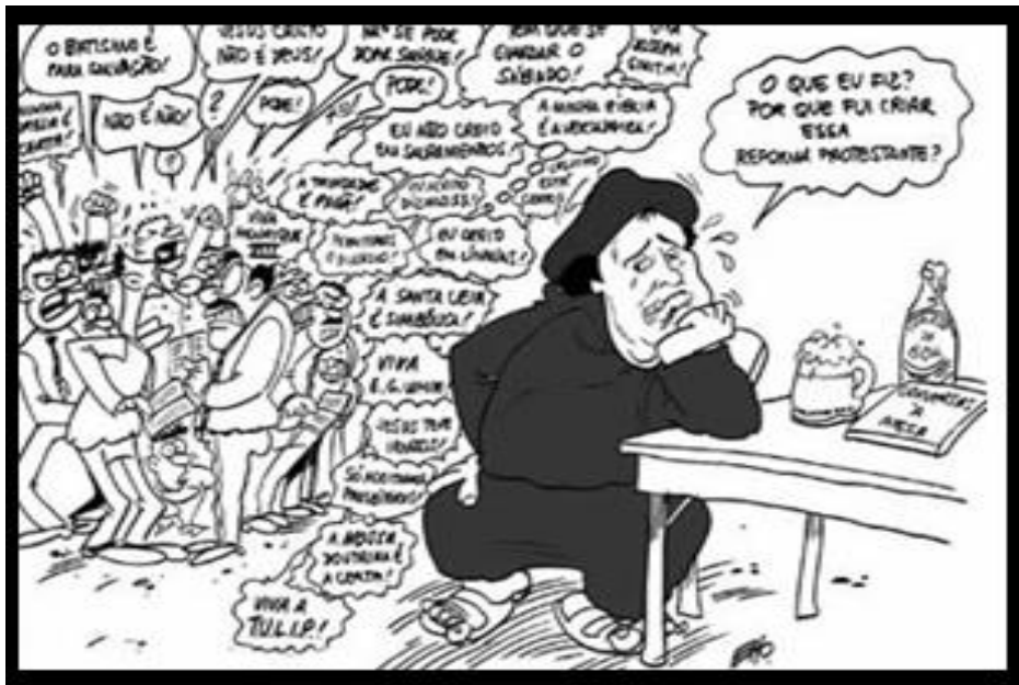
Figura 1 - Reforma Protestante

Alusão: Acontece com elementos que fazem lembrar outra obra e outro autor. São as alusões, ou seja, as referências identificadas no contexto, enriquecendo a leitura ou contribuindo para a interpretação da mensagem. Isso recobre os fenômenos de interpretação (Paráfrase, paródia, Charges satíricas).