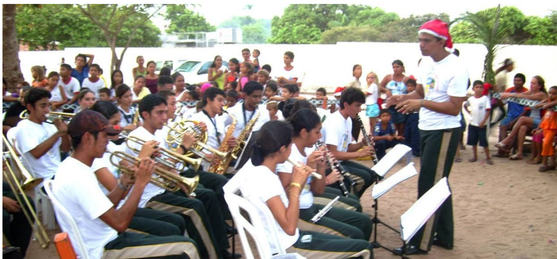
Foto 2 - Banda da Prefeitura em recepção aos presentes