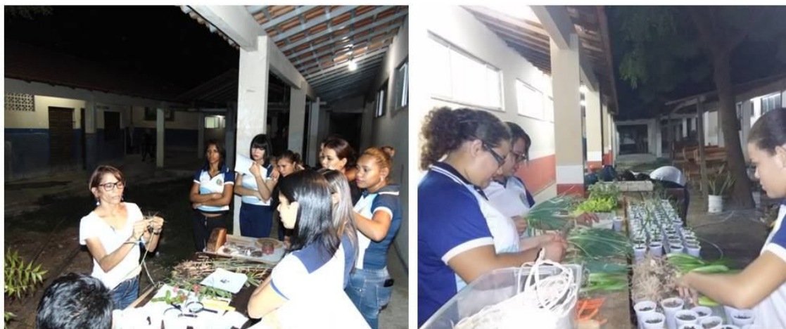
Figura 9 - Seleção de hortaliças para o cultivo

Nessa etapa as orientações ocorreram para os diferentes tipos de propagação de espécies vegetais. O tema alinhado com o conteúdo programático de Biologia.