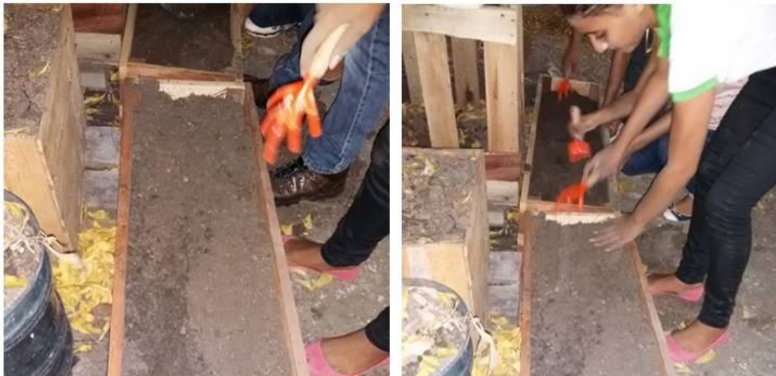
Figura 8 - Adubação dos canteiros e preparação de covas

7º Passo: Adubação dos canteiros e preparação de covas;