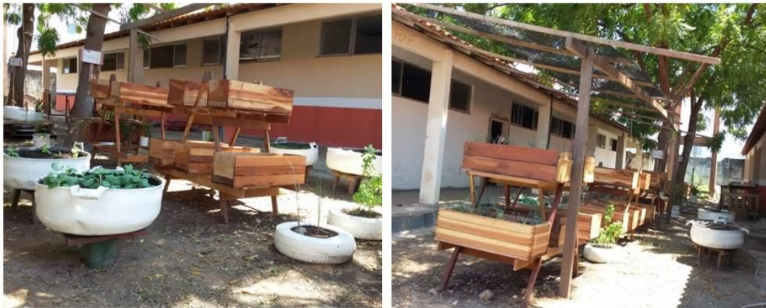
Figura 11 - Tratos culturais da horta

Ocorre semanalmente pelos estudantes durante atividades escolares, em dias alternados.