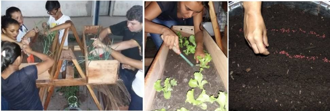
Figura 10 – Plantio