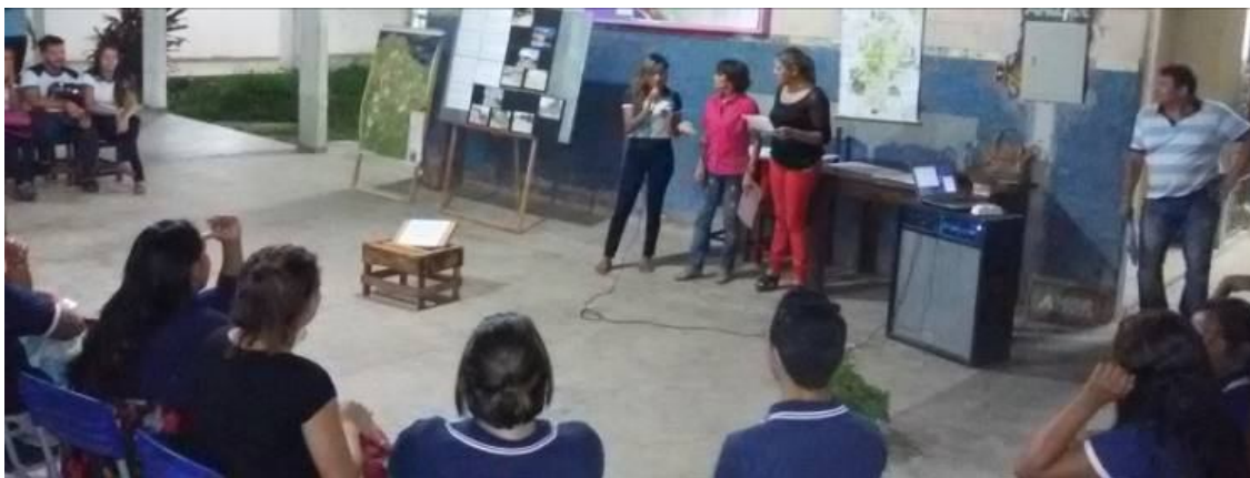
Figura 2 - Encontro integrado com alunos para Sensibilização Ambiental