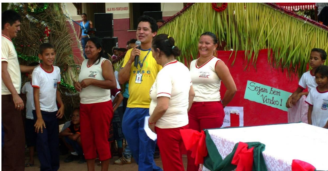
Foto 6 - SESC Parceria que envolve a todos