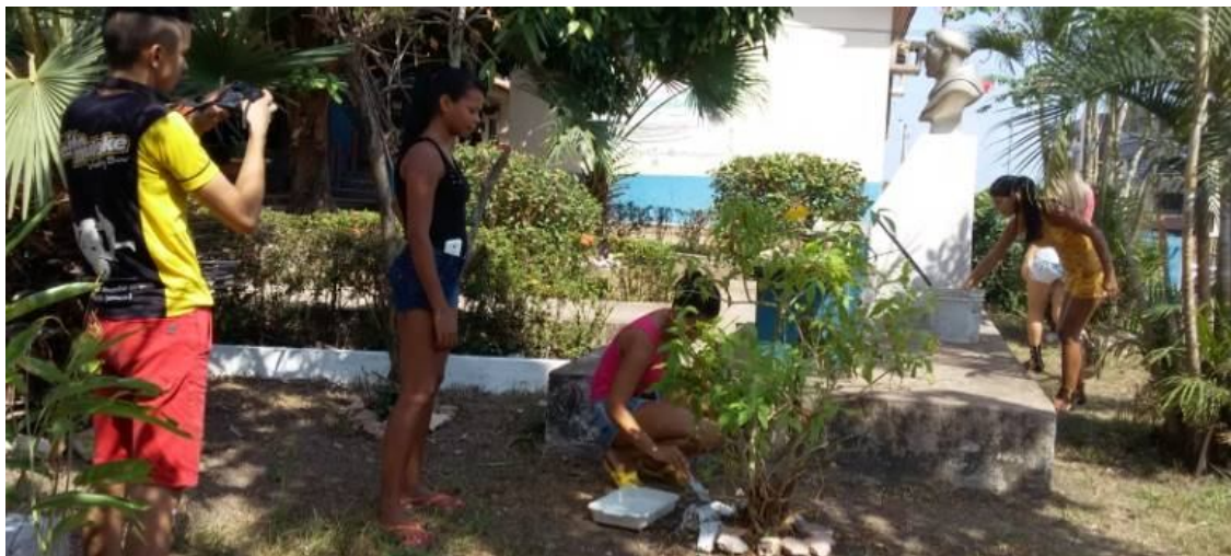
Figura 3 - Momento de revitalização do jardim da Escola Frei Ambrósio, Santarém-PA