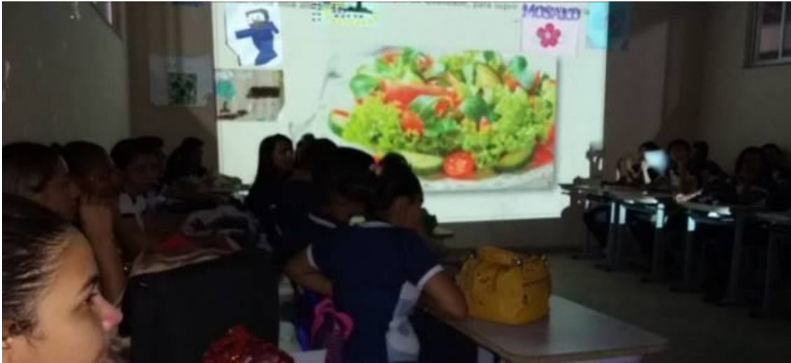
Figura 5 - Orientação técnica em sala de aula sobre Horticultura

1º Passo: Informações técnicas para os alunos que emitiram seus conceitos baseados na vivência cultural e a professora alinhou com o conceito técnico científico (Figura 5).