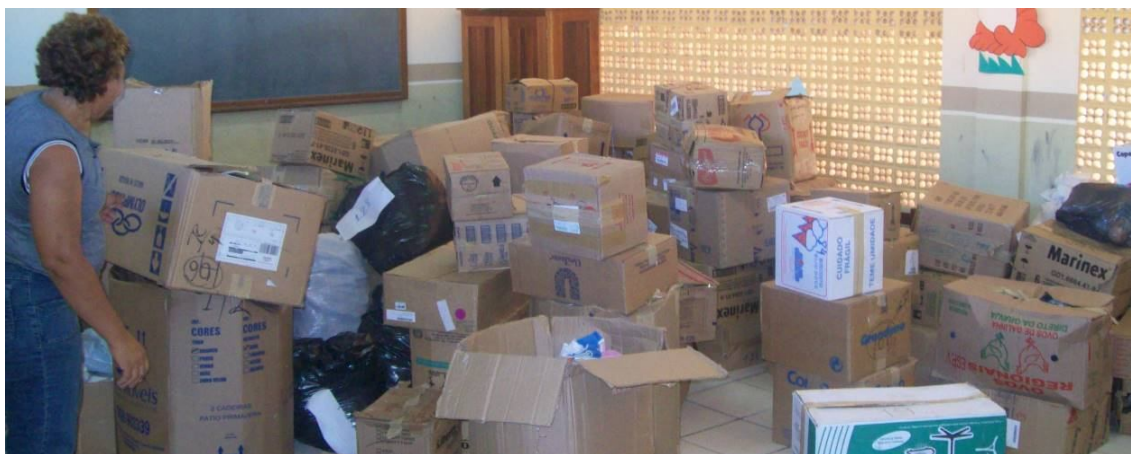
Foto 9 - Material doado e recebido p escola contemplada