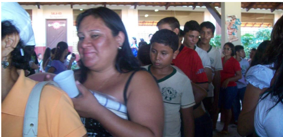
Foto 10 - Ao final lanche aos presentes