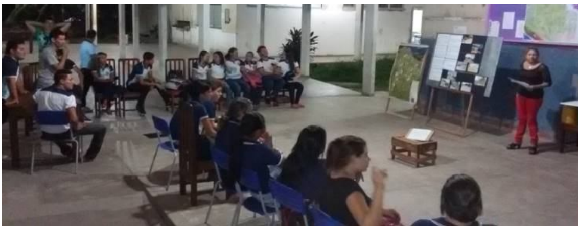
Figura 1 - Encontro integrado com alunos para Sensibilização Ambiental

Após encontro (Figura 1), definiu-se que a primeira tarefa em dia extraclasse seria um dia de revitalização do jardim da escola (Figura 2). Assim, elevar a sensibilização para alternativas sustentáveis na resolução de problemas atuais e na prevenção de problemas futuros da escola.