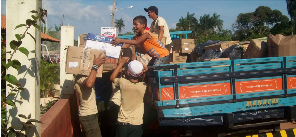
Foto 7 - Chegada dos donativos na escola contemplada