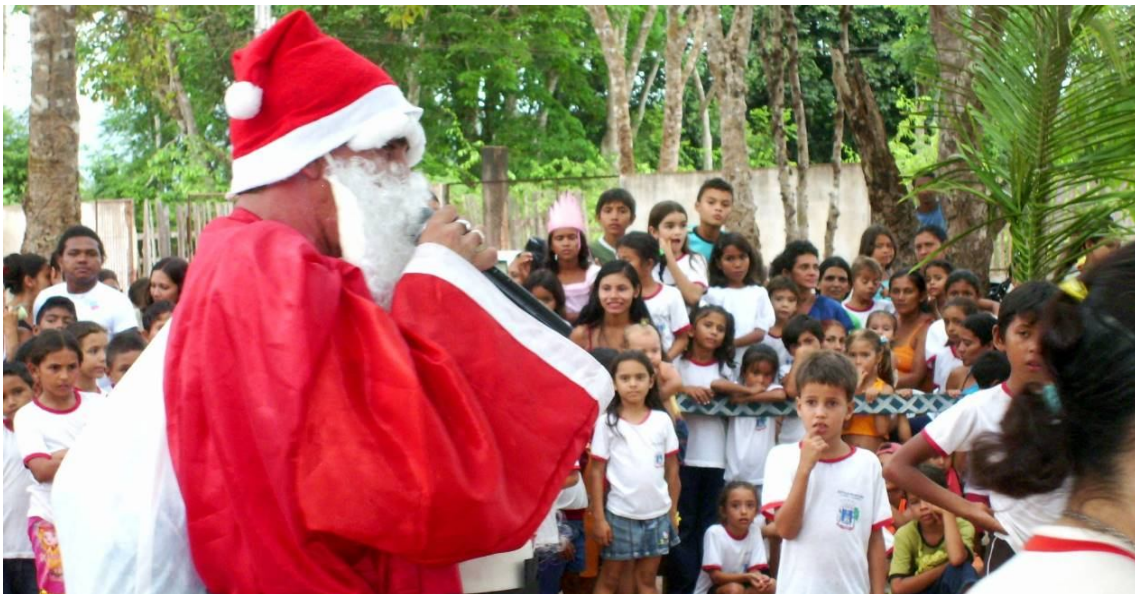
Foto 8 - Papai Noel para entrega dos donativos