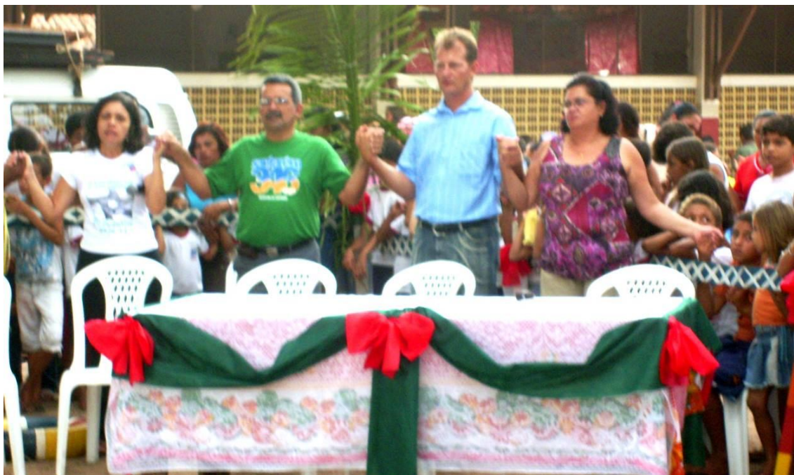
Foto 1 - Abertura do evento: Comunidade de mãos dadas em agradecimento pelos donativos recebidos