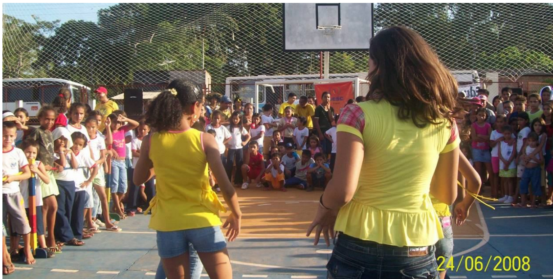
Foto 5 - Esporte interativo – fortalecimento à convivência e a saúde (Escola Terezinha e Escola contemplada)