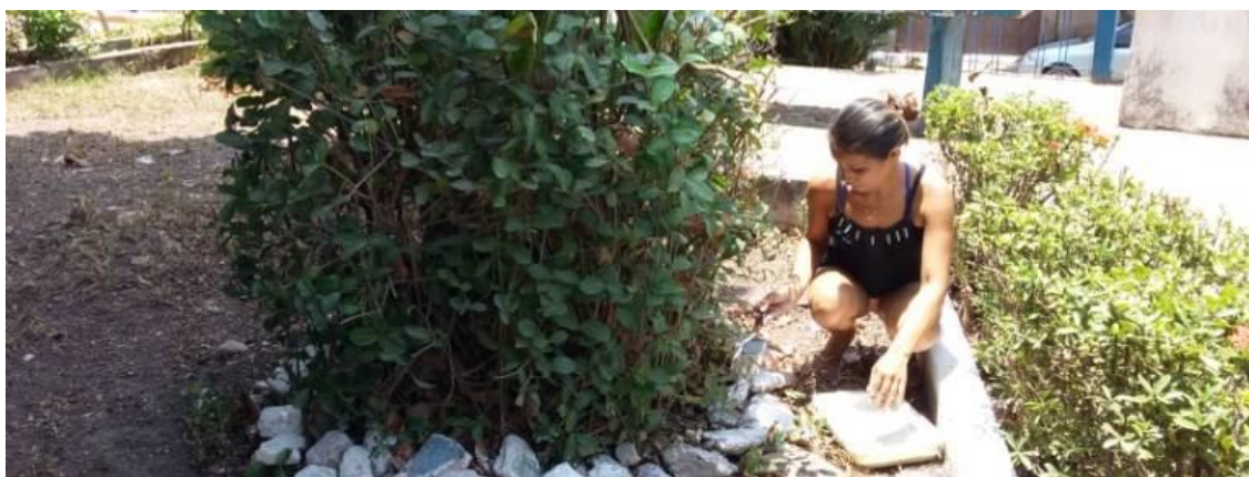
Figura 4 - Momento de revitalização do jardim da Escola Frei Ambrósio, Santarém-PA