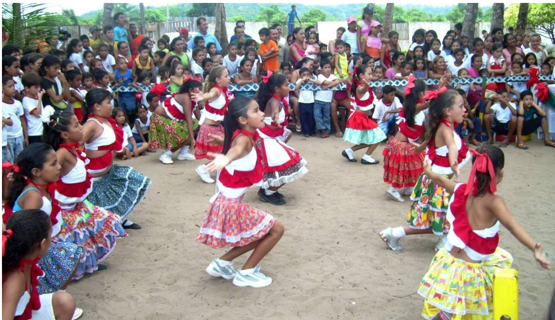
Foto 4 - Dança regional como estímulo a cultura