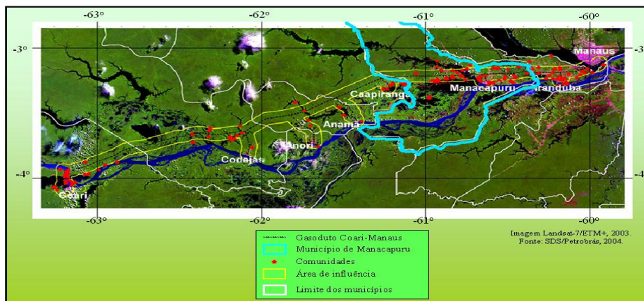
Figura 1. Área do Traçado do Gasoduto Coari-Manaus. 47