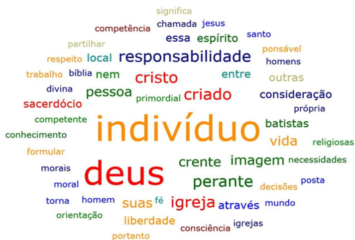
Figura 2 - Nuvem de Palavras a partir do termo Indivíduo