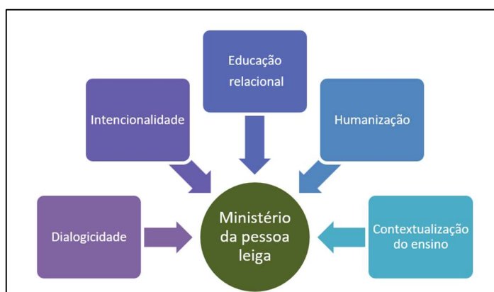
Figura 4 - Parâmetros estruturadores da Educação pela pessoa leiga

Na Figura 4 são demonstrados os parâmetros da educação moderna, cujas características apontam para o mistério da pessoa leiga.